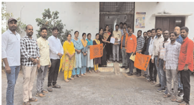
పరిష్కారం కోసం పిఆర్పి రిపోర్టు వెంటనే తెప్పించుకొని 51% ప్రకటించాలని పెండింగ్లో ఉన్న డి ఎ లను, ఈ కుబేర్ లో ఉన్న బిల్లులను సత్తరమే చెల్లించాలని కేజీబీవీ, మోడల్ స్కూల్ ఉపాధ్యాయ సంస్థలు వెంటనే