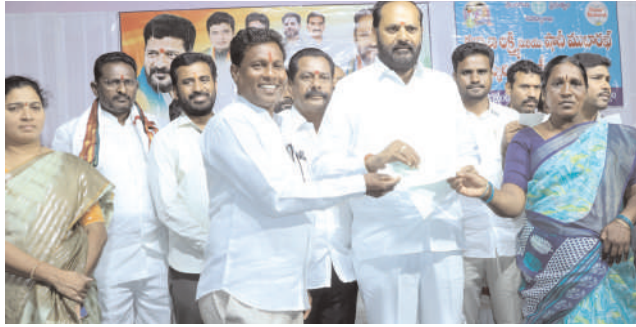
చురకలు ప్రతినిధి కమాన్ పూర్ (పెద్దపల్లి) జూలై 4 : పెద్దపల్లి జిల్లా కేం ద్రంలోని ఆర్.ఆర్ గార్డెన్స్ లో శనివారం రోజున పెద్దపల్లి నియోజకవర్గానికి సం బంధించిన వివిధ గ్రామాలకు చెందిన 578 మంది -2లో