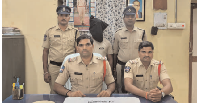
పలువురిని విచారించగా నిందితులు వెళ్లినట్లు పోలీసులు గుర్తించారు. జిల్లా స్థానిక బిర్లానీ సెంటర్లో పనిచేసి అనంతరం తమ రాష్ట్రం ఒడిషాకు