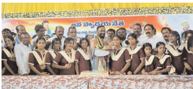
వివిధ హోదాల నాయకులు కార్యకర్తల తో కలిసి కేక్ కట్ చేసి జన్మదిన వేడుకలను ఘనముగా చేపట్టారు. కాంగ్రెస్ పార్టీ ప్రజా ప్రభుత్వం ఏర్పడిన తర్వాత అభివృద్ధి సంక్షేమ ధ్యేయంగా కృషి చేస్తున్న ముఖ్యమంత్రి రేవంత్ రెడ్డి నాయకత్వంలో తెలంగాణ రాష్ట్ర కార్పొరేషన్ చైర్మన్ కోరుట్ల