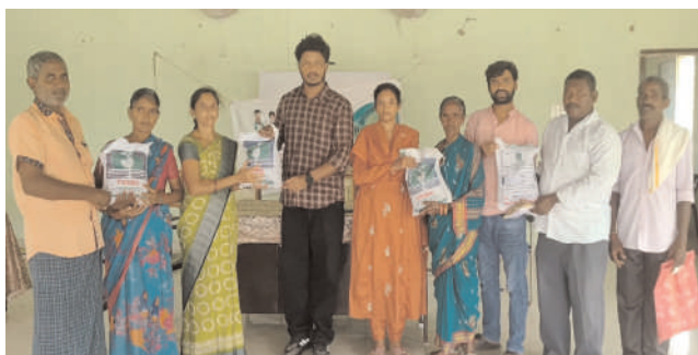
రైతువేదికలో రైతులకు కందుల విత్తనాలు సబ్బిడీపై అందుబాటులో ఉన్నాయని, ప్రతి విత్తన ప్యాకెట్ పూర్తి ధర రూ. 520 కాగా, ప్రభుత్వం రూ. 120 సబ్బిడీ అందిస్తోంది. దీంతో రైతులు కేవలం రూ. 400 మాత్రమే