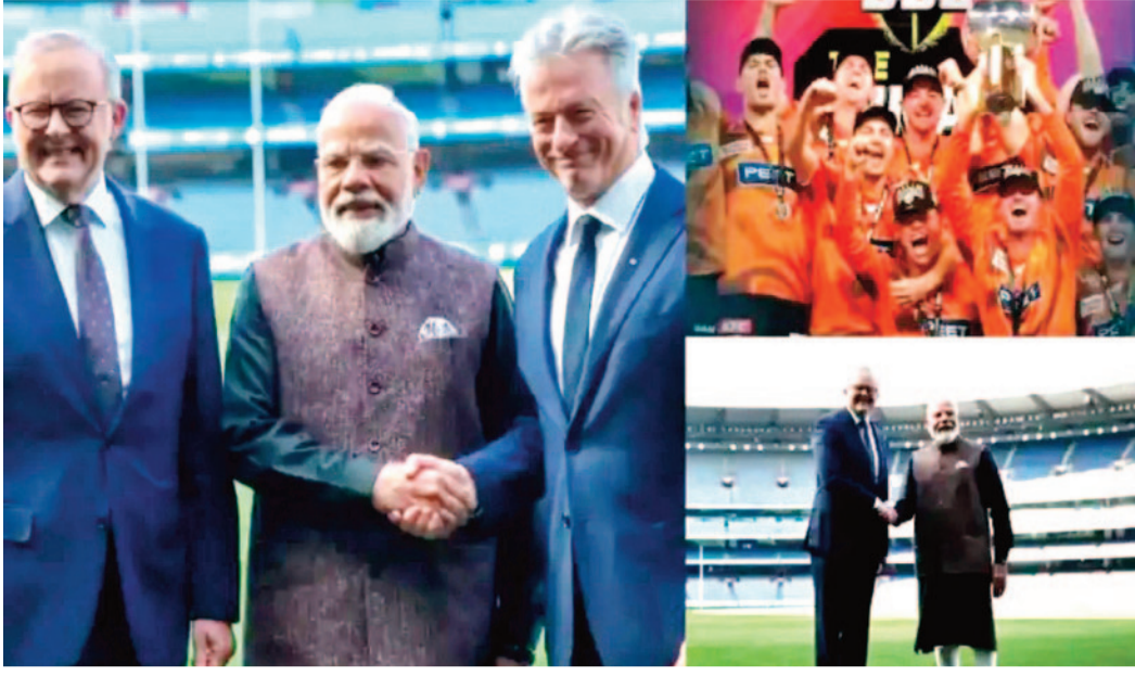
చెన్నై జూలై 10: ప్రపంచ క్రికెట్లో అత్యంత ఆదరణ పొందిన లీగ్లలో ఒకటైన ఆస్ట్రేలియా బిగ్ బాష్ లీగ్ చరిత్రలో తొలిసారిగా విదేశీ గడ్డపై అధికారిక మ్యాచ్ను నిర్వహించనుంది. బిగ్ బాష్ లీగ్ 2026-27 సీజన్కు సంబంధించిన ప్రారంభ మ్యాచ్ను తమిళనాడు రాజధాని చెన్నైలో నిర్వహించనున్నట్లు అధికారికంగా ప్రకటించారు. ఆస్ట్రేలియా పర్యటనలో ఉన్న భారత ప్రధాని నరేంద్ర మోదీ, ఆస్ట్రేలియా ప్రధాని ఆంథోనీ అల్బానీస్ మెల్బోర్న్లో ఈ నిర్ణయాన్ని ప్రకటించారు. క్రికెట్ ఆస్ట్రేలియా వెబ్సైటులోని వివరాల ప్రకారం డిసెంబర్ 12న చెన్నైలోని

ఎం.ఎ. చిదంబరం స్టేడియంలో ఈ చారిత్రాత్మక మ్యాచ్ జరగనుంది. ఈ మ్యాచ్లో డిఫెండింగ్ ఛాంపియన్ మెల్బోర్న్ రెనెగేడ్స్ జట్టు, పెర్త్ స్కార్పర్స్ తలపడనుంది. ఈ పోరులో మెల్బోర్న్ రెనెగేడ్స్ చోట జట్టుగా బరిలోకి దిగనుండటం విశేషం. విదేశీ దేశీయ క్రికెట్ లీగ్కు చెందిన అధికారిక మ్యాచ్కు భారత్ అతిథ్యం ఇవ్వడం ఇదే తొలిసారి కావడం మరో ప్రత్యేకతగా నిలిచింది. ఈ మ్యాచ్ విజయవంతంగా నిర్వహించేందుకు భారత క్రికెట్ నియంత్రణ మండలి కూడా మార్చి సహకారం అందించనున్నట్లు తెలిపింది. ఈ సందర్భంగా ప్రధాని నరేంద్ర మోదీ మాట్లాడుతూ భారత్, ఆస్ట్రేలియా మధ్య క్రిడా సంబంధాలను మరింత బలోపేతం చేసే చారిత్రాత్మక అడుగుగా ఈ మ్యాచ్ను అభివర్ణించారు. చెన్నైలో జరిగే ఈ ప్రత్యేక పోరులో గెలుపోటముల కంటే ఆట స్ఫూర్తి, ఇరు దేశాల స్నేహబంధమే ప్రధాన ఆకర్షణగా నిలుస్తుందని ఆయన పేర్కొన్నారు. బిగ్ బాష్ లీగ్ను భారత క్రికెట్ అభిమానులకు మరింత చేరువ చేయడమే లక్ష్యంగా ఈ నిర్ణయం తీసుకున్నట్లు నిర్వాహకులు తెలిపారు. మ్యాచ్తో పాటు చెన్నైలో సాంస్కృతిక, చలనచిత్ర ఉత్సవాలను కూడా నిర్వహించనున్నట్లు వెల్లడించారు. ఈ కార్యక్రమాల ద్వారా రెండు దేశాల మధ్య పర్యాటకం, వ్యాపారం, సాంస్కృతిక సంబంధాలు మరింత బలోపేతం అవుతాయని నిర్వాహకులు ఆశాభావం వ్యక్తం చేశారు.