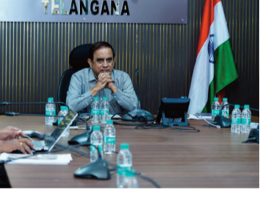
హైదరాబాద్, జూలై 10