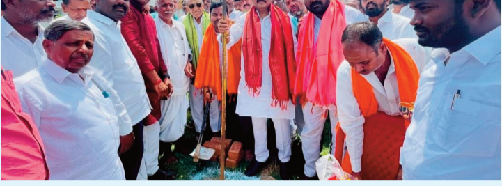
కులచర్య మండలం, జూలై 10