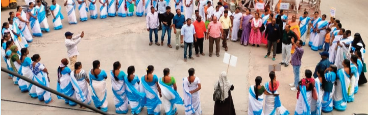
మహబూబ్ నగర్ జూలై 10