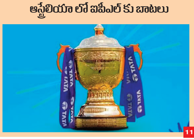
ఆస్ట్రేలియా లో పోటీలకు బాటలు

Published From Jagital, Hyderabad, Adilabad, Warangal