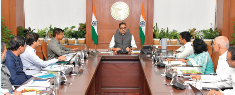
హైదరాబాద్, జూలై 10