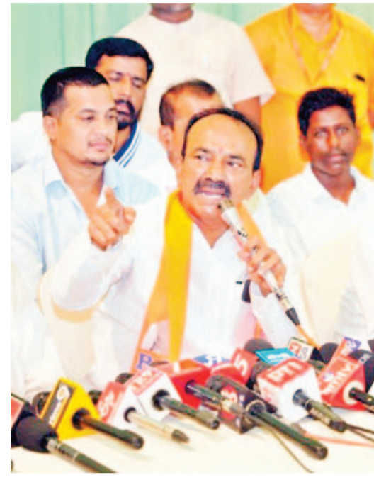
అదే తన అసలైన గుర్తింపు అని ఈటల రాజేందర్ ఉద్ఘాటించారు. "నాకు తెలంగాణే ముఖ్యం.. ఆ తర్వాతే పార్టీ, వ్యక్తిగత విషయాలు. రాజకీయాల కోసం తెలంగాణ

నాకు తెలంగాణే ముఖ్యం.. తాను తెలంగాణ మట్టిబిడ్డనని, ఒక ఉద్యమకారుడినని..