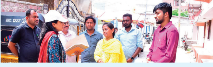
వేముల వాడ జూలై 10