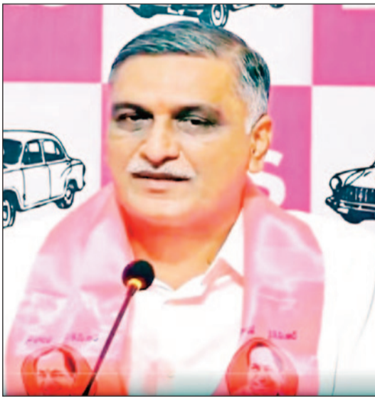
కొత్త డ్రామాలకు తెర..

రాష్ట్రంలో లేని అప్పులను ఉన్నట్టుగా చూపిస్తూ కాంగ్రెస్ నేతలు గోబెల్స్ ప్రచారం చేస్తున్నారని హారీశ్ రావు మండిపడ్డారు. ప్రభుత్వం ప్రస్తుతం ఎదుర్కొంటున్న వైఫల్యాల