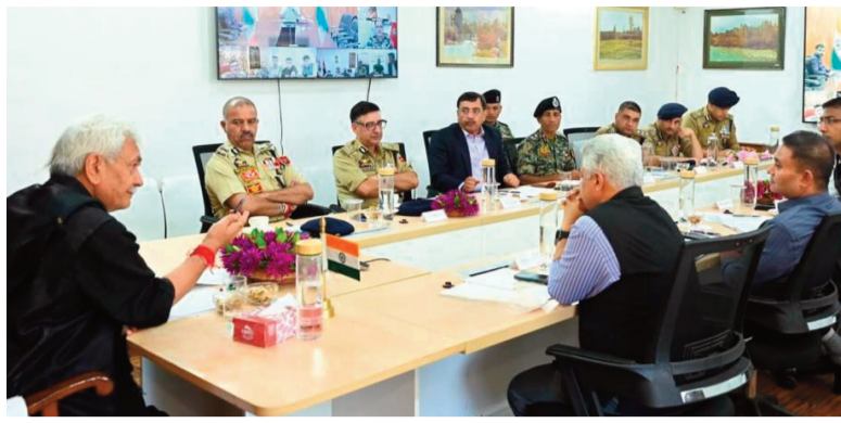
జమ్మూ కాశ్మీర్ జూలై 4

శ్రీ అమర్నాథ్ యాత్ర-2026 నిర్వహణపై జమ్మూ కాశ్మీర్ లెఫ్టినెంట్ గవర్నర్ మనోజ్ సిన్హా ఉన్నతస్థాయి సమీక్ష నిర్వహించారు. యాత్రికుల రద్దీ, ట్రాఫిక్, భద్రత, వసతి, నమోదు ప్రక్రియ తదితర అంశాలను పరిశీలించారు. చెల్లుబాటు అయ్యే నమోదు (రిజిస్ట్రేషన్) లేకుండా పెద్ద సంఖ్యలో యాత్రికులు రావడం వల్ల నిరీక్షణ సమయం పెరుగుతోందని అధికారులు తెలిపారు. కేటాయించిన తేదీకి చెల్లుబాటు అయ్యే నమోదు పత్రం ఉన్నవారికే పవిత్ర గుహకు వెళ్లించుకు అనుమతి ఉంటుందని స్పష్టం చేశారు. నమోదు చేసుకోని యాత్రికులు కొన్ని రోజులు ప్రయాణాన్ని వాయిదా వేసుకోవాలని, తప్పనిసరిగా యాత్ర అనుమతి పత్రం పొందిన తర్వాతే జమ్మూ కాశ్మీర్ కు రావాలని లెఫ్టినెంట్ గవర్నర్ విజ్ఞప్తి చేశారు. యాత్ర భద్రత, నిర్వహణ కోసం అన్ని శాఖలు, భద్రతా బలగాలు, లంగర్ సంస్థలు, స్వచ్ఛంద సంస్థలు సమన్వయంతో పనిచేయాలని ఆదేశించారు.