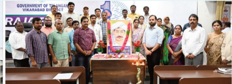
వికారాబాద్, జూలై 04