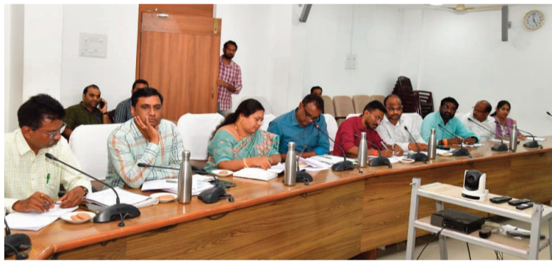
కరీం నగర్ జూలై 4.

రానున్న వానాకాలం ధాన్యం కొనుగోళ్లను సజావుగా నిర్వహించేందుకు 100 రోజుల ముందస్తు ప్రణాళిక రూపొందిస్తున్నట్లు రాష్ట్ర పౌరసరఫరాల శాఖ సంచాలకులు శ్యాం ప్రసాద్ లాల్ తెలిపారు. కరీంనగర్ లో ఉమ్మడి జిల్లా రైస్ మిల్లర్ల సంఘం ప్రతినిధులు, పౌరసరఫరాల శాఖ అధికారులు, జిల్లా మేనేజర్లతో నిర్వహించిన సమావేశంలో ఆయన మాట్లాడారు. గత యాసంగిలో అధికారులు, మిల్లర్ల సమన్వయంతో రాష్ట్రవ్యాప్తంగా సుమారు 82 లక్షల మెట్రిక్ టన్నుల ధాన్యం కొనుగోలు చేశామని, ఈ వానాకాలంలో 80 లక్షల మెట్రిక్ టన్నుల దిగుబడి వచ్చే అవకాశం ఉందని చెప్పారు. అందుకు అనుగుణంగా ముందస్తు ఏర్పాట్లు పూర్తి చేయాలని సూచించారు. ప్రభుత్వం నిర్దేశించిన గడువులోగా 100 శాతం మిల్లింగ్ లక్ష్యాలు పూర్తి చేయాలని, అవసరమైతే మిల్లుల్లో పని గంటలు పెంచి నిరంతరాయంగా మిల్లింగ్ నిర్వహించాలని ఆదేశించారు. ప్రతి మిల్లుకు ఒక మానిటరింగ్ అధికారిని నియమించి, పౌరసరఫరాల శాఖ అధికారులు, తహసీల్దార్లు క్షేత్రస్థాయిలో మిల్లింగ్ ప్రక్రియను నిరంతరం పర్యవేక్షించాలని సూచించారు.