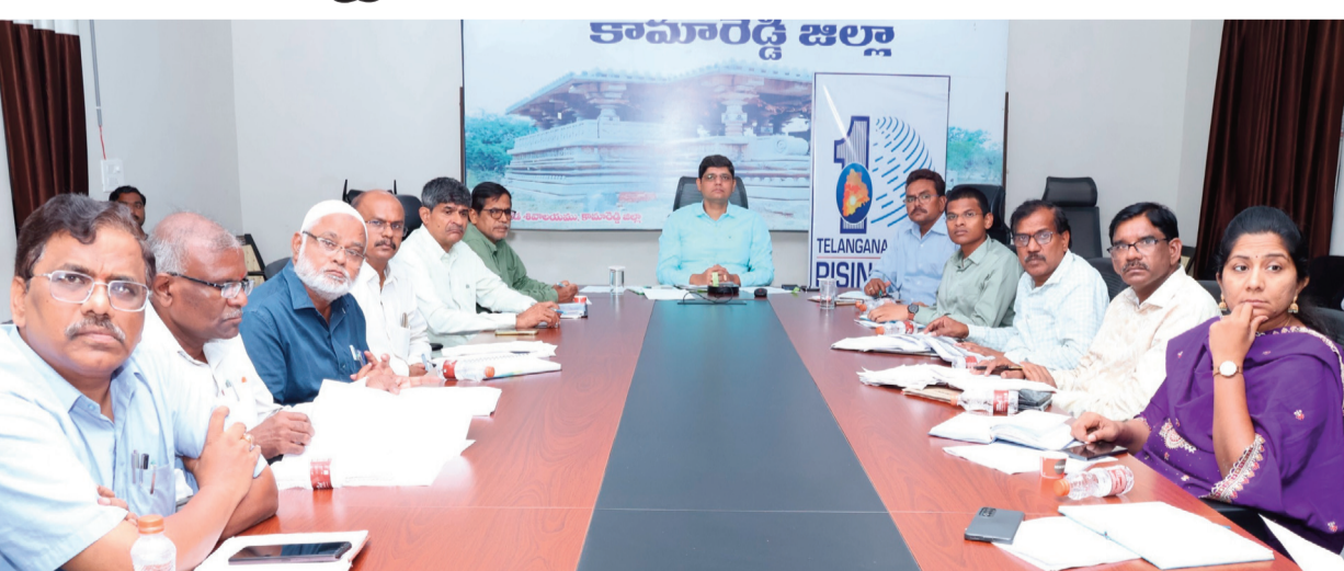
కలెక్టర్ ఆశీష్ సాంగ్వాన్