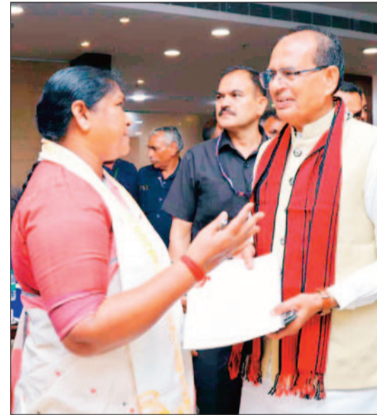
ఉపాధి హామీలో పాత వాటాయే..

న్యూఢిల్లీ జూన్ 29 : ఢిల్లీ వేదికగా జరిగిన జాతీయ గ్రామీణాభివృద్ధి సదస్సులో తెలంగాణ గణాన్ని రాష్ట్ర మంత్రి సీతక్క బలంగా వినిపించారు. కేంద్ర ప్రభుత్వం కొత్తగా తెస్తున్న 60:40 నిధుల విధానంపై తీవ్ర అభ్యంతరం వ్యక్తం చేశారు. కేంద్రమంత్రి శివరాజ్ సింగ్ చౌహాన్ ను కలిసి పెండింగ్ నిధులు, అటవీ అనుమతులపై కీలక వివరించడం సమర్పించారు. కేంద్ర ప్రభుత్వం గ్రామీణాభివృద్ధి పథకాలకు సంబంధించి తీసుకొస్తున్న కొత్త నిధుల విధానాలపై రాష్ట్ర మంత్రి సీతక్క తీవ్ర అసంతృప్తి వ్యక్తం చేశారు. సోమవారం ఢిల్లీలో జరిగిన జాతీయ సదస్సులో ఆమె పాల్గొన్నారు. వికసిత గ్రామాలు 2047 ఆశయం నెరవేరాలన్నా, పల్లెలు స్వయంసమృద్ధి సాధించాలన్నా రాష్ట్రాలపై కేంద్రం అదనపు ఆర్థిక భారం మోపకూడదని ఆమె స్పష్టం చేశారు. కొత్తగా ప్రతిపాదించిన 60:40 నిధుల విధానంతో రాష్ట్రాలపై ఊహించిన రీతిలో భారం పడుతుందన్నారు. ఈ నిబంధనలపై జూలై 2 న జరగబోయే రాష్ట్ర క్యాబినెట్ సమావేశంలో తుది నిర్ణయం తీసుకుంటామని వెల్లడించారు.