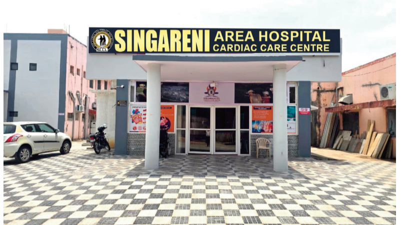
వైద్యం అందించడం ద్వారా వేలాది నిలుస్తుందిని సింగరేణి యాజమాన్య ప్రాణాలను కాపాడగల కేంద్రంగా ఇది తెలిసింది.

మొత్తం కోల్ బెల్ట్ ప్రాంత ప్రజలకు ప్రయోజనం చేకూరుతుంది. 7,890 చదరపు అడుగుల విస్తీర్ణంలో ఏర్పాటు చేసిన ఈ కేంద్రంలో ఐసీసీయూ, ఐసీయూ, బెటేపేషెంట్ విభాగాలు అందుబాటులో ఉంటాయి. ప్రభుత్వ ప్రైవేట్ భాగస్వామ్యంతో ఏర్పాటు చేసిన ఈ కేంద్రంపై ఏడేళ్లలో సింగరేణి సుమారు రూ.50 కోట్లు చెల్లించనుండగా, నెలకు సుమారు 3 వేల మందికి సేవలు అందే అవకాశం ఉంది. బెడ్ సామర్థ్యంలో 50 శాతం సింగరేణి ఉద్యోగులు, వారి కుటుంబ సభ్యులు, విశ్రాంత ఉద్యోగులకు కేటాయింపు నున్నారు. స్థానికంగానే అత్యాధునిక గుండె