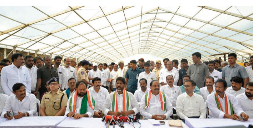
ఖమ్మం జూన్ 29:

ఖమ్మం జిల్లా చింతకాని మండలం జగన్నాథపురంలో జూన్ 30న నిర్వహించాల్సిన రైతు ఆశీర్వాద సభను భారీ వర్షాల కారణంగా వాయిదా వేసినట్లు ఉప ముఖ్యమంత్రి భట్టి విక్రమార్కు ప్రకటించారు. సభా ప్రాంగణం బురదమయంగా మారడంతో రైతులు, ప్రజలు, కార్యకర్తలకు ఇబ్బందులు కలగకుండా ఈ నిర్ణయం తీసుకున్నట్లు