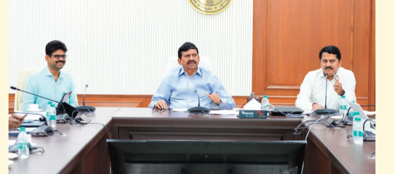
హైదరాబాద్, జూన్ 29: