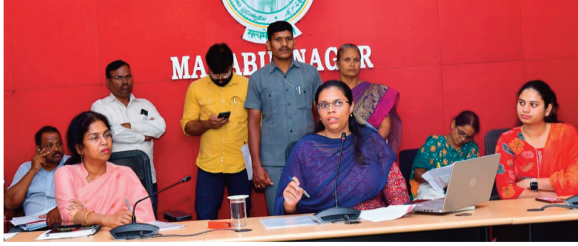
జిల్లా కలెక్టర్ కుమ్మూ గుప్తా మహాబాబ్ నగర్ జూన్ 29:

తాగునీరు, పారిశుధ్యం, ఆహార భద్రతపై ప్రత్యేక దృష్టి: కలెక్టర్ కుమ్మూ గుప్తా వరాకాలంలో ప్రజారోగ్య పరిరక్షణకు తాగునీటి సరఫరా, పారిశుధ్యం, ఆహార భద్రత అంశాలపై అన్ని శాఖలు సమన్వయంతో పనిచేయాలని జిల్లా కలెక్టర్ కుమ్మూ గుప్తా ఆదేశించారు. ప్రజావాణి అసంతరం నిర్వహించిన జిల్లా వాటర్ అండ్