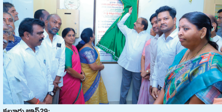
కల్లూరు జూన్ 29: