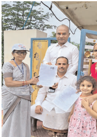
ఓటర్లు తప్పకుండా అందించాలన్నారు. అలాగే బూత్ లెవెల్ అధికారులు

-ఓటర్ జాబితాలో ఉన్న వారందరూ ఎన్యూమరేషన్ ఫారం తప్పనిసరిగా నింపాలి