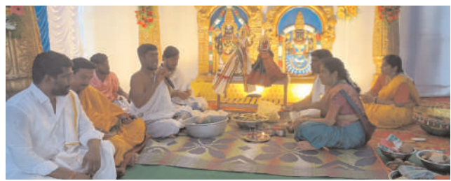
చురకలు విలేఖరి వీణవంక జూన్ 26 : వీణవంక మండల పరిధిలోని

ఘనుక్ష గ్రామంలో శుక్రవారం స్థానిక శివాలయంలో శ్రీ శివపార్వతుల