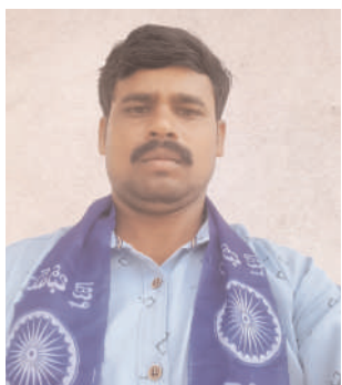
దగా ఎస్సీ వర్గీకరణ అనంతరం గ్రూప్-3 కింద మాల, మాల ఉపకులాలకు 5శాతం రిజర్వేషన్ కల్పిస్తున్నామని

-మాల యువత ఉద్యోగ అవకాశాలను కోల్పోతుంది -రాజన్న సిరిసిల్ల జిల్లా అధ్యక్షులు దోసల చంద్రం