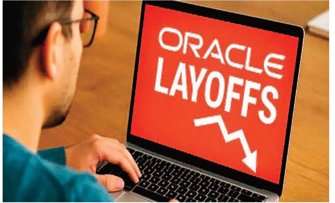
ప్రవేశపెట్టడం వల్లే ఈ సిబ్బంది తగ్గింపు జరిగిందని తెలిసింది. సంస్థ స్పష్టం చేసింది. ఏవ వలన సామర్థ్యం పెరుగుతున్నప్పటికీ, భవిష్యత్తులో కూడా ఆటోమేషన్, ఏవ ఆధారిత వ్యవస్థల అదే స్థాయిలో ఉద్యోగ భద్రతపై ప్రశ్నలు పెరుగుతున్నాయని కారణంగా మరన్ని ఉద్యోగ కోతలు జరిగే అవకాశం ఉందని నిపుణులు హెచ్చరిస్తున్నారు.

న్యూఢిల్లీ, జూన్ 23 : కృత్రిమ మేధ సాంకేతికత వేగంగా విస్తరిస్తుండటంతో వ్యాపార రంగంలో పెద్ద మార్పులు చోటుచేసుకుంటున్నాయి. అదే సమయంలో ఉద్యోగ మార్కెట్పై కూడా దీని ప్రభావం తీవ్రంగా పడుతోంది. దీనికి ప్రత్యక్ష ఉదాహరణగా అమెరికన్ టెక్నాలజీ దిగ్గజం ఒరాకిల్ భారీ స్థాయిలో ఉద్యోగులను తొలగించడం ఇప్పుడు చర్చనీయాంశంగా మారింది. ఒరాకిల్ తాజాగా సమర్పించిన వార్షిక నివేదిక ప్రకారం 2026 ఆర్థిక సంవత్సరంలో సంస్థ తన మొత్తం ఉద్యోగులలో సుమారు 13 శాతం మందిని తగ్గించింది. గత ఏడాది సుమారు 1,62,000 మంది ఉద్యోగులు ఉండగా, 2026 మే 31 నాటికి ఆ సంఖ్య 1,41,000కు పడిపోయింది. అంటే ఒక ఏడాదిలో దాదాపు 21,000 మంది ఉద్యోగాలు కోల్పోయారు. ఈ ఉద్యోగ కోతల ప్రభావం భారత్లో కూడా గణనీయంగా కనిపించింది. బెంగళూరు, హైదరాబాద్, పుణె వంటి నగరాల్లో ఉన్న ఒరాకిల్ కార్యాలయాల్లో పనిచేస్తున్న ఉద్యోగుల్లో సుమారు 10,000 మంది ప్రభావితమయ్యారని సమాచారం. ఇది భారత సిబ్బందిలో దాదాపు 20 శాతం వరకు ఉంటుందని అంచనా. కంపెనీ ప్రకారం, తమ వ్యాపార ప్రక్రియలన్నింటిలో కృత్రిమ మేధ సాంకేతికతను విస్తృతంగా