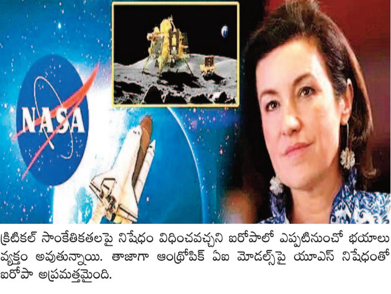
క్రిటికల్ సాంకేతికతలపై నిషేధం విధించవచ్చని ఐరోపాలో ఎప్పటినుంచో భయాలు వ్యక్తం అవుతున్నాయి. తాజాగా ఆంథ్రోపిక్ ఏట మోడల్స్పై యూఎస్ నిషేధంతో ఐరోపా అప్రమత్తమైంది.

బెర్లిన్/పారిస్: ఏట సంస్థ ఆంథ్రోపిక్కు చెందిన అత్యాధునిక ఏట మోడల్స్ ఇతర దేశాలకు అందకుండా అమెరికా ప్రభుత్వం నిషేధించడంపై ఐరోపాలో తీవ్ర అసంతృప్తి వ్యక్తం అవుతోంది. ఏట రంగంలో సార్యభూమత్వం సాధించాలన్న డిమాండ్ పెరుగుతున్నాయి. ఈ నేపథ్యంలో జర్మనీ అంతర్జాతీయ పరిశోధన శాఖ మంత్రి డొరొతి బార్ కీలక వ్యాఖ్యలు చేశారు. అమెరికా అంతర్జాతీయ ప్రయోగాలకు ఐరోపా, జర్మనీ అందరికీ సాంకేతికతలు కీలకమని గుర్తు చేశారు. మేము లేకపోతే నానా స్పేస్ మిషన్లు సాధ్యం కాదు. ఐరోపా సర్వీస్ మాడ్యూల్ లేకుండా నానా చంద్రుడిని చేరలేదు' అని ఇటీవల వీవాటెక్ ట్రేడ్ షో సందర్భంగా మంత్రి కీలక వ్యాఖ్యలు చేశారు. అంతర్జాతీయ రంగంలో అధిపత్యం కోసం మరో కూటమి కూడా ఏర్పాటైందని మంత్రి డొరొతి పేర్కొన్నారు. రష్యా, చైనా, ఉత్తర కొరియా, ఇరాన్ దేశాలు అంతర్జాతీయ రంగంలో ఐరోపాను అధిగమించకూడదని స్పష్టం చేశారు. అమెరికా టెక్నాలజీపై ఆధారపడటాన్ని తగ్గించుకోవాలని ఐరోపా సమాఖ్య భావిస్తోంది. సెమీ కండక్టర్లు మొదలు, క్షాన్డ్ కంప్యూటింగ్, ఏట వరకూ వివిధ రంగాల్లో స్పేస్ సంస్థల అభివృద్ధిపై దృష్టిసారించింది. ఇందుకోసం ఒక వ్యూహాన్ని కూడా రూపొందించుకుంది. ఆర్థికంగా, రాజకీయంగా తాము కోల్పోయిన ప్రాభవాన్ని మళ్ళీ దక్కించుకోవాలన్న లక్ష్యాన్ని నిర్దేశించుకుంది. ఐరోపా, అమెరికా మధ్య విభేదాలు పెరిగితే అధ్యక్షుడు ట్రంప్