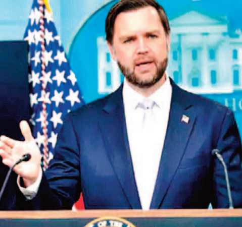
వాషింగ్టన్, జూన్ 23: పాకిస్తాన్పై ప్రేమను వ్యక్తం చేస్తూ అమెరికా ఉపాధ్యక్షుడు జెడ్ వాస్ ఇటీవల చేసిన వ్యాఖ్యలపై అమెరికాకు చెందిన ఇద్దరు సెనేటర్లు తీవ్రంగా వ్యతిరేకించారు. ఆ దేశ ఉగ్రచరిత్ర గురించి ప్రస్తావిస్తూ, బిన్ లాడెన్ ను దాచిన ఘనత పాకిస్తాన్ అన్నారు. ఈ నేపథ్యంలో పాకిస్తాన్, ఖతార్ దేశాలపై

దశాబ్దాల నాటి ఉగ్రవాద ప్రచారాన్ని ప్రోత్సహించడానికే మొగ్గు చూపుతున్నట్లు కనిపిస్తోంది. అందరికీ ప్రయోజనం చేకూర్చే అవసరమైన ఒప్పందానికి ఇంకా ఆసాధం ఉంది' అని ఆయన చెప్పుకోవచ్చారు. ఈ సందర్భంగా మోంటానా సెనేటర్ టిమ్ వీపీ కూడా పాకిస్తాన్ ను విమర్శించారు. 'పాకిస్తాన్ ఒక దశాబ్దం పాటు బిన్ లాడెన్ కు ఆశ్రయం ఇచ్చిందనే విషయాన్ని మనం మరిచిపోకూడదు. పాకిస్తాన్లు ఐఎన్ఐఐ ద్వారా మామై పోరాడే వారికి నిధులు సమకూర్చారు. ముఖ్యంగా అయతుల్లాకు నిధులు అందించారు. ఖతార్ కూడా దశాబ్దాలుగా ఉగ్రవాద సంస్థలకు మనీలాండరింగ్ ద్వారా డబ్బును అందిస్తోంది. ఇరాన్, అమెరికా- ఇజ్రాయెల్ శాంతి ఒప్పందంలో పాకిస్తాన్, ఖతార్లు పాల్గొంటే.. ఆ చర్చల్లో యూఏఈ, ఇజ్రాయెల్, సౌదీ అరేబియాలునూ చేర్చుకోవాలి. మధ్యప్రాచ్యంలో ఆ మూడు దేశాలే అమెరికాకు నిజమైన మిత్రదేశాలు' అని పేర్కొన్నారు. కాగా, వీరి వ్యాఖ్యలు ఇప్పటికే ఉన్న వివాదానికి మరింత ఆజ్యం పోసిస్తున్నాయి.