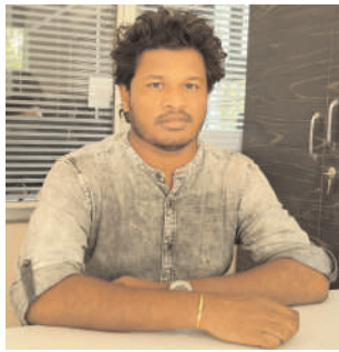
శాఖ ఆదేశాల మేరకు ఇబ్రహీంపట్నం మండలంలోని అన్ని రైతు వేదికలలో