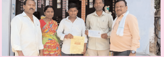
చురకలు విలేజ్ వివేకాచారి జూన్ 17 : వీణవంక ప్రభుత్వ జూనియర్ కళాశాలలో 2026-27 విద్యా సంవత్సరానికి కళాశాలలో ప్రథమ సంవత్సరంలో చేర్పించడానికి ప్రిన్సిపాల్ మరియు అధ్యాపక బృందం పదవ తరగతి ఉత్తీర్ణులైన విద్యార్థుల ఇంటింటికి వెళ్లి ప్రచారం చేస్తూ అడ్మిషన్లు పెంచుటానికి కృషి చేయించున్నారు. కళాశాలలో గల మౌలిక వసతులను మరియు బోధన అనుభవం గురించి వివరించుచున్నారు. అడ్మిషన్ పొందిన విద్యార్థులకు వెంటనే ఉచిత పాఠ్యపుస్తకాలను అందజేయుచున్నారు.