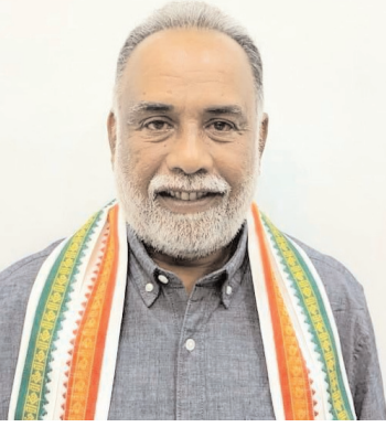
మంజూరయ్యాయి. కాగా ఆయా గ్రామాల్లో సిసి రోడ్ల నిర్మాణానికి మంజూరు చేశారు. నిధులు మంజూరు కి కృషి చేసిన రాష్ట్ర ఐటీ పరిశ్రమల శాఖ మంత్రి దుర్గిళ్ల శ్రీధర్ బాబుకు కృతజ్ఞతలు తెలియజేశారు. అలాగే బామ్మా నాయక్ తండ ఐదు లక్షల రూపాయలు, కన్నాలకు 5 లక్షల రూపాయలు, జీడి నగర్ కు 5 లక్షల రూపాయలు, రానాపూర్ కు 5 లక్షల రూపాయలు మంజూరయ్యాయి.

చురకలు ప్రతినిధి కమాన్ పూర్ జూన్ 17 : కమాన్ పూర్ మండలంలోని వివిధ గ్రామాల్లో ఉపాధి హామీ పథకం కింద రోడ్ల నిర్మాణానికి 60 లక్షల రూపాయలు మంజూరు అయినట్లు కమాన్ పూర్ మండల కాంగ్రెస్ అధ్యక్షుడు సయ్యద్ సయీద్ అన్వర్ తెలిపారు. రాష్ట్ర ఐటీ పరిశ్రమల శాఖ మంత్రి దుర్గిళ్ల శ్రీధర్ బాబు ఆదేశాల మేరకు ఆయా గ్రామాల్లో సిసి రోడ్ల నిర్మాణానికి గాను ఉపాధి హామీ పథకంలో ఈ నిధులు మంజూరయ్యాయి. గొల్లపల్లి ఐదు లక్షల, గుండాం 5 లక్షల రూపాయలు, కమాన్ పూర్ వేర్వేరుగా ఐదు లక్షల చొప్పున 20 లక్షల రూపాయలు మంజూరయ్యాయి. నాగారం 5,00,000 లింగాల 5 లక్షలు, వీరపల్లి 5 లక్షల రూపాయలు, రొంపి కుంట ఐదు లక్షల రూపాయలు, సిద్ది పల్లె ఐదు లక్షల రూపాయలు