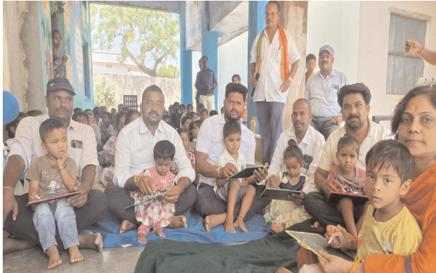
-నోట్ బుక్స్ పంపిణీ

చురకలు విలేజ్ ఇబ్రహీంపట్నం, జూన్ (17) : జగిత్యాల జిల్లా ఇబ్రహీంపట్నం మండలం లోని డబ్బా గ్రామం లో ప్రభుత్వ పాఠశాల లో బుద్దాలి బుచ్చన్న సామూహిక అక్షరాభ్యాసం బుక్స్ పంపిణీ కార్యక్రమం జరిగింది. విద్యార్థులకు సామూహిక అక్షర బ్యాసం చేయించారు. ఈ కార్యక్రమంలో ప్రభుత్వ పాఠశాల ప్రధానోపాధ్యాయులు