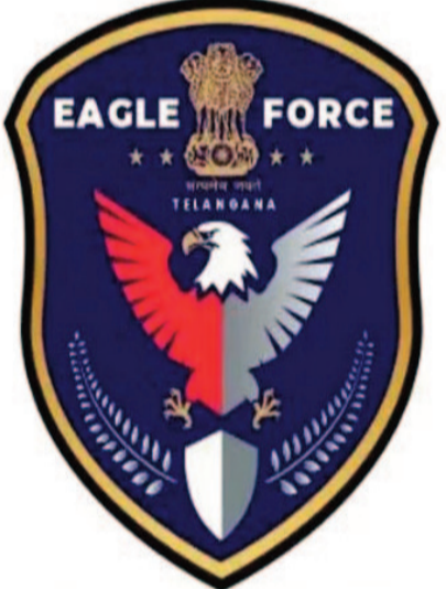
ELITE ACTION GROUP FOR DRUG LAW ENFORCEMENT

హైదరాబాద్: రాష్ట్రవ్యాప్తంగా గంజాయి, డ్రగ్స్ వినియోగంపై భారీగా ఫిర్యాదులు అందుతున్న నేపథ్యంలో ఈగిల్ ఫోర్స్ రంగంలోకి దిగింది. మంగళవారం పలు ప్రాంతాల్లో ఏకకాలంలో దాడులు నిర్వహించి 19 మందిని అదుపులోకి తీసుకుంది. గోవా నుంచి హైదరాబాద్ కు డ్రగ్స్ సరఫరా చేస్తున్న ముఠా గుట్టును ఈ దాడుల ద్వారా అధికారులు రట్టు చేశారు. పట్టుబడిన వారందరినీ డి అడిక్షన్ కేంద్రాలకు తరలించారు. హైదరాబాద్, సైబరాబాద్, మల్కాజ్ గిరి, పూర్వ నీటి కమిషనరీలతో పాటు మహబూబ్ నగర్, నిజామాబాద్ జిల్లాల్లో ఈగిల్ ఫోర్స్ దాడులు నిర్వహించింది. మొత్తం 15 బృందాలు ఏకకాలంలో ఈ ఆపరేషన్ చేపట్టాయి. అదుపులోకి తీసుకున్న 19 మందికి వైద్య పరీక్షలు నిర్వహించగా.. వారిలో 14 మందికి గంజాయి పాజిటివ్, మరో వ్యక్తికి డ్రగ్స్ పాజిటివ్ నిర్ధారణ అయింది. పట్టుబడిన వారందరూ మత్తు పదార్థాలు వాడినట్లు విచారణలో అంగీకరించారని అధికారులు తెలిపారు.