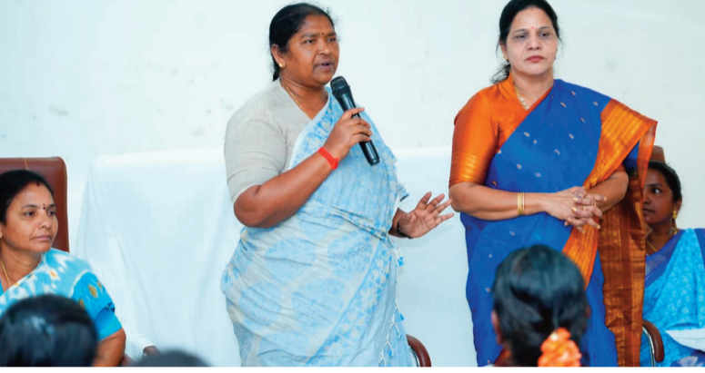
ములుగు, జూన్ 16: (సమయం న్యూస్).