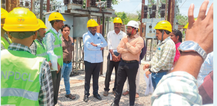
నర్సల్, జూన్ 16:

ఎస్పీడిసీఎల్ సీఎండ్ కర్నూటి వరుణ్ రెడ్డి ఐఏఎస్ మంగళవారం నిర్మల్ సర్కిల్లో పర్యటించి, వరాల వల్ల దెబ్బతిన్న విద్యుత్ లైన్లను పరిశీలించారు. కడెం, ఖానాపూర్ పరిధిలోని గ్రామాలలో పరిస్థితిని సమీక్షించి, విద్యుత్ అంతరాయాలు నివారించేందుకు ముందస్తు చర్యలు చేపట్టాలని అధికారులను ఆదేశించారు. 33/11 కేవీ కడెం విద్యుత్ ఉపకేంద్రాన్ని సందర్శించిన సీఎండ్, వినియోగదారులకు నాణ్యమైన, నిరంతరాయ విద్యుత్ సరఫరా అందించేలా చర్యలు తీసుకోవాలని సూచించారు. కడెం, పెంబి అటవీ ప్రాంతాల గుండా వెళ్లే 33 కేవీ, 11 కేవీ లైన్లపై కవర్ కండక్టర్ల ఏర్పాటు చేయాలని ఆదేశించారు. కడెం, పెంబి, దన్నూరాబాద్ సబ్ స్టేషన్లకు ప్రత్యామ్నాయ విద్యుత్ సరఫరా ఏర్పాటు చేస్తున్నట్లు తెలిపారు. తాళ్లపేటలో 132 కేవీ సబ్ స్టేషన్ కు మంజూరు లభించిందని, నిర్మల్-ఖానాపూర్ 132 కేవీ లైన్ ను డబుల్ సర్క్యూట్ గా అభివృద్ధి చేస్తామని వెల్లడించారు. విద్యుత్ నిర్వహణ పనుల్లో భద్రతా ప్రమాణాలను కచ్చితంగా పాటించాలని, సీపీఈ కిట్లు తప్పనిసరిగా వినియోగించాలని నిర్బంధిస్తూ సూచించారు. వినియోగదారుల సమస్యలను సత్కరమే పరిష్కరించాలని అధికారులను ఆదేశించారు.