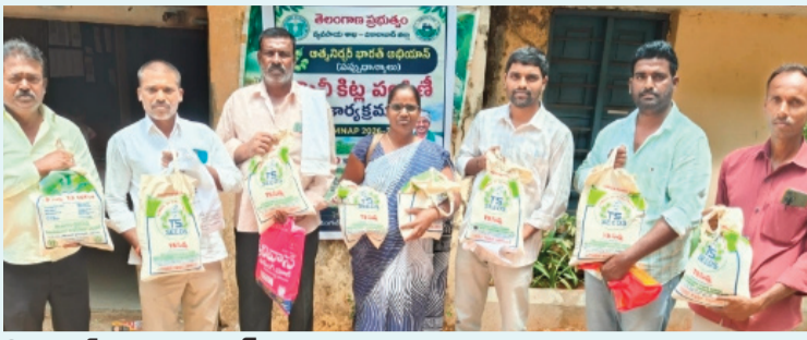
కొండగల్ మండలం, జూన్ 12

శుక్రవారం రుద్రారం క్లస్టర్ పరిధిలో రెడ్ గ్రామ్ విత్తనాల పంపిణీ కార్యక్రమం నిర్వహించబడింది. ఈ సందర్భంగా, TDRG-59 అనే అధిక దిగుబడి ఇచ్చే విత్తన రకం రైతులకు అందజేయబడింది.