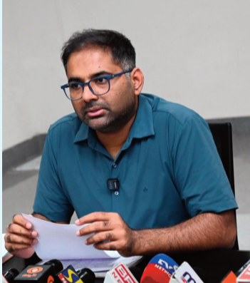
పెద్దపల్లి, జూన్ 12