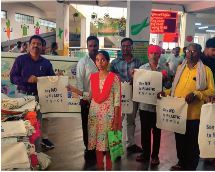
సిద్దిపేట, జూన్ 12