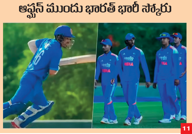
ఆఫ్టన్ ముందు భారత్ భారీ సర్కారు

Published From Jagital, Hyderabad, Adilabad, Warangal