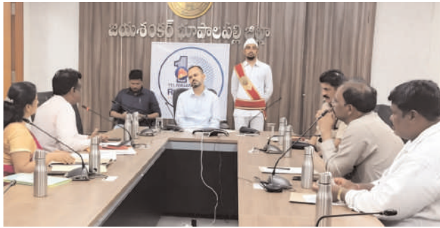
నిర్వహించారు. ఈ సందర్భంగా కలెక్టర్ మాట్లాడుతూ నిబంధనలు ఉల్లంఘించిన వారిపై కఠిన చర్యలు తీసుకోవాలని ఆదేశించారు. పీసీ పీఎన్డీటీ చట్టం, క్లినికల్ ఎస్టాబ్లిష్మెంట్ యాక్టు నిబంధనలను కచ్చితంగా అమలు చేయాలని సంబంధిత అధికారులకు సూచించారు.