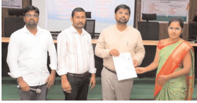
ఆహార భద్రత శాఖ అధికారి వాసురాం, ఇతర అధికారులతో కలిసి హాజరయ్యారు. ఈ సందర్భంగా జిల్లా కలెక్టర్ కుమార్ దీపక్ మాట్లాడుతూ ఆహార భద్రత ప్రమాణాలను అందరూ పాటించాలని తెలిపారు. ప్రభుత్వ

చురకలు ప్రతినిధి, మంచినీటి, జూన్ 11 : ఆహార భద్రత విషయంలో ప్రతి ఒక్కరు నాణ్యత ప్రమాణాలు పాటించాలని జిల్లా కలెక్టర్ కుమార్ దీపక్ అన్నారు. గురువారం జిల్లాలోని నస్సార్ లో గల సమీకృత జిల్లా కార్యాలయాల భవన సమావేశ మందిరంలో ఆహార భద్రత శాఖ అధ్యక్షులతో అంగన్వాడీ టీచర్లకు నిర్వహించిన శిక్షణ కార్యక్రమానికి