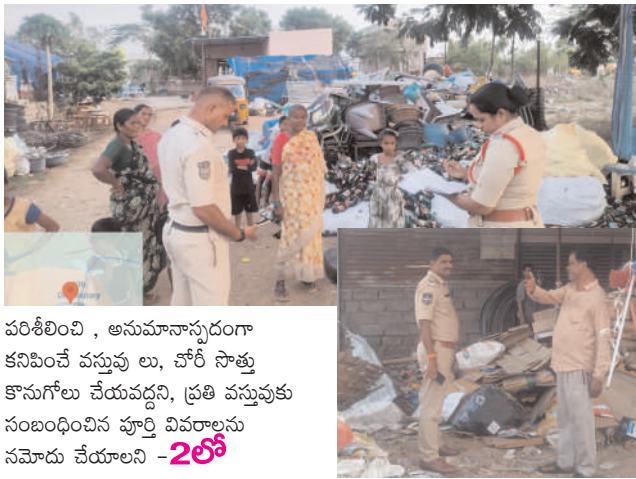
పరిశీలించి, అనుమానాస్పదంగా కనిపించే వస్తువులు, చోరీ సాక్షు కొనుగోలు చేయవద్దని, ప్రతి వస్తువుకు సంబంధించిన పూర్తి వివరాలను నమోదు చేయాలని - 2లో

చురకలు ప్రతినిధి ఎల్లారెడ్డి పేట జూన్ 11 : జిల్లాలో నేరాల నియంత్రణ, చోరీ సాక్షు కొనుగోలు మరియు విక్రయాలను అరికట్టేడమే లక్ష్యంతో జిల్లా పోలీసుల ఆధ్వర్యంలో గురువారం జిల్లా వ్యాప్తంగా అన్ని పోలీస్ స్టేషన్ల పరిధిలోని స్ట్రాప్ దుకాణాలపై ఆకస్మిక తనిఖీలు నిర్వహిస్తున్నట్లు జిల్లా ఎస్పీ మహేష్ బి. గిత్ తెలిపారు. ఈ తనిఖీల్లో భాగంగా స్ట్రాప్ దుకాణాల యజమానులు కొనుగోలు చేస్తున్న వస్తువులకు సంబంధించిన రికార్డులు, బిల్లులు, కొనుగోలుదారుల వివరాలను