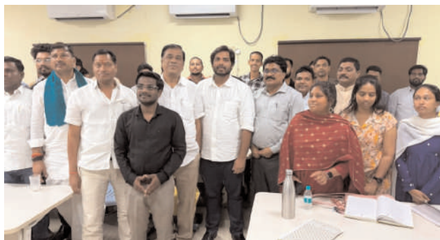
భాషా నైపుణ్యాలను పెంపొందించుకొని విదేశాల్లో స్థిరపడేందుకు అవసరమైన సహకారం అందించనున్నట్లు హామీ ఇచ్చారు. జర్మనీ భాషశిక్షణ కార్యక్రమాన్ని యువతకు అందుబాటు లోకి తీసుకురావడం లో రాష్ట్ర కార్యకర్త శాఖ మంత్రి గడ్డం వివేక్ వెంకటస్వామి ప్రత్యేకమైన చొరవ చూపారని తెలిపారు.

చురకలు ప్రతినిధి, మంచీర్యాల, జూన్ 11 : మంచీర్యాల జిల్లా మండలంలో టామ్ కామ్ ఆధ్వర్యంలో సింగరేణి సంస్థ సహకారంతో నిర్వహిస్తున్న జర్మనీ భాష శిక్షణ కార్యక్రమాన్ని గురువారం పెద్దపల్లి ఎంపీ గడ్డం వంశీకృష్ణ పరిశీలించారు. శిక్షణ పొందుతున్న యువతి యువకులతో స్వయంగా మాట్లాడి వారి అభిప్రాయాలను తెలుసుకున్నారు. ఈ సందర్భంగా ఎంపీ గడ్డం వంశీకృష్ణ మాట్లాడుతూ యువత విదేశీ భాషలపై పట్టు సాధించి జర్మనీతో పాటు ఇతర దేశాల్లో ఉన్నత విద్య, ఉపాధి అవకాశాలను అందిస్తున్నారని సూచించారు.