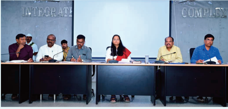
మెదక్, జూన్ 9: