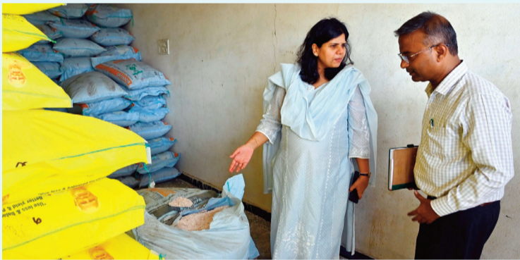
నిజామాబాద్, జూన్ 09:

జిల్లాలో యూరియా నిల్వల సరిపడా అందుబాటులో ఉన్నాయని, రైతులు ఆందోళన చెందాల్సిన అవసరం లేదని కలెక్టర్ ఇలా త్రిపాలి తెలిపారు. మంగళవారం ఎడపల్లి మండలంలోని జానకంపేట్, ఎడపల్లి ఎరువుల గిడ్డంగులు, విక్రయ కేంద్రాలను ఆమె తనిఖీ చేశారు. ప్రతి స్టాక్ పాయింట్ లో యూరియా అందుబాటులో ఉండేలా పర్యవేక్షిస్తున్నామని, బుకింగ్ యాప్ ద్వారా పారదర్శకంగా, ప్రణాళికాబద్ధంగా పంపిణీ చేస్తున్నామని చెప్పారు. ప్రస్తుతం జిల్లాలో 27 వేల మెట్రిక్ టన్నులకంటే ఎక్కువ యూరియా నిల్వలు ఉన్నాయని వెల్లడించారు. నాన్ యూరియా వినియోగంపై రైతులకు అవగాహన కల్పించాలని, అయితే కొనుగోలుకు బలవంతం చేయరాదని డిలర్రను హెచ్చరించారు. రైతులు అవసరానికి మించి ఎరువులు, పురుగుమందులు వాడకుండా వ్యవసాయ అధికారుల సూచనలు పాటించాలని కలెక్టర్ కోరారు.