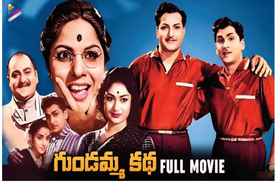
చక్రపాణి కథను సరికొత్తగా మలిచారు.

కథలో చిన్న చిన్న మార్పులు చేసి డి.వి.నరసరాజుతో ట్రైబ్యూట్, మాటలు రాయించారు నాగిరెడ్డి. మొదట ఈ సినీమాకు దర్శకునిగా నాగిరెడ్డి నోదరుడు బి.న్.రెడ్డిని అనుకున్నారు. అయితే బి.న్.రెడ్డి కళాత్మక చిత్రాల తరహా దర్శకుడు కావడమూ, ఇది ఆయన శైలి సినీమా కాకపోవడంతో వేరే దర్శకుడితో చేయాలని నిర్ణయించారు. ఆ తర్వాత పి.పుల్లయ్యకు నరసరాజు సిద్ధం చేసిన డైలాగ్ వెర్షన్ పంపగా, ఆయనకు ఈ కథ, ట్రైబ్యూట్ సచ్చకపోవడంతో ప్రాజెక్టు నుంచి తప్పుకున్నారు. దాంతో సినీమా నిర్మాణం మళ్ళీ వెనుక బడింది. ఈ తరుణంలో నాగిరెడ్డి ఆ స్క్రిప్టును తన సన్నిహితుడు, సహా నిర్మాత, రచయిత అయిన చక్రపాణికి ఇచ్చారు. ఎలాగైనా సినీమా తీయాలనే పట్టుదలతో ఉన్న చక్రపాణి మొత్తం స్క్రిప్టును తిరగరాశారు. విలియం షేక్స్పియర్ రాసిన ప్రసిద్ధ నాటకం “ద టేమింగ్ ఆఫ్ ద డ్రూ” లోని కథానాయికల పాత్రలను, వారి స్వభావాలను ఆధారంగా చేసుకుని