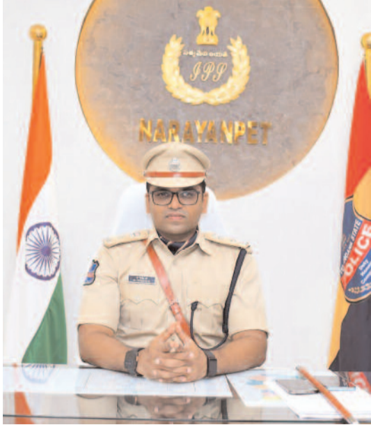
రస్యపూర్వకంగా పరిష్కరించుకోవాలని సూచించారు.జాతీయ