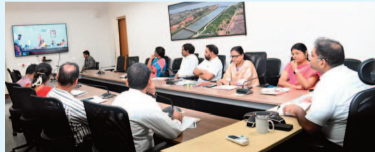
విద్యాశాఖ ప్రధాన కార్యదర్శి యోగితా రాణి