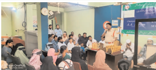
మాట్లాడుతూ ఎస్ఎస్సి టాపర్లను అవార్డులతో సన్మానించడం గర్వ కారణమని తెలిపారు. విద్యార్థులు ఉన్నత చదువుల వైపు అడుగులు వేయాలని ఇంటర్మీడియట్లో చేరి మరింత కష్టపడి చదవాలని సూచించారు. టీనేజ్ వయస్సులో శారీరక మానసిక మార్పులు సహజమని ఈదశలో తల్లిదండ్రులు పిల్లల ప్రవర్తనపై ప్రత్యేక శ్రద్ధ పెట్టి వారికి సరైన మార్గదర్శనం చేయాలని సూచించారు. చిన్నప్పటి నుంచి కలిసి చదివిన స్నేహితులతో