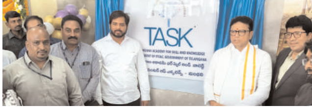
ప్రభావాలు, గేమింగ్, కామిక్స్, కృత్రిమ మేధస్సు వంటి ఆధునిక రంగాల్లో శిక్షణ పొందితే యువతకు విస్తృత ఉపాధి అవకాశాలు సిద్ధమవుతాయని తెలిపారు. గ్రామీణ విద్యార్థులు కూడా ప్రపంచ స్థాయి సాంకేతిక పరిజ్ఞానాన్ని నేర్చుకునే వేదికగా ఈ కేంద్రాలు నిలుస్తాయని పేర్కొన్నారు. తెలంగాణ అకాడమీ ఫర్ స్మిల్ అండ్ నాలెడ్జ్ అండ్

చురకలు ప్రతినిధి కమాన్ పూర్ మే 6 : మంధని లో టాస్కో-ఏవీజీసీ & కృత్రిమ మేధస్సు కేంద్రం మరియు టాస్కో-సీటిఎల్ఎస్ ప్రతిభా కేంద్రం ప్రారంభోత్సవంలో పాల్గొన్న పెద్దపల్లి ఎంపీ గడ్డం వంశీకృష్ణ గ్రామీణ యువతకు ఆధునిక సాంకేతిక నైపుణ్యాలు అందించాలనే లక్ష్యంతో మంధనిలో టాస్కో-ఏవీజీసీ & కృత్రిమ మేధస్సు కేంద్రం, టాస్కో-సీటిఎల్ఎస్ ప్రతిభా కేంద్రం ప్రారంభోత్సవం ఘనంగా జరిగింది. కార్యక్రమంలో పెద్దపల్లి ఎంపీ గడ్డం వంశీకృష్ణ, రాష్ట్ర టీఎస్ పీ మంత్రి దుద్దిల శ్రీధర్ బాబు కలిసి పాల్గొని కేంద్రాలను ప్రారంభించారు. ఈ సందర్భంగా వారు ఆనిమేషన్, దృశ్య