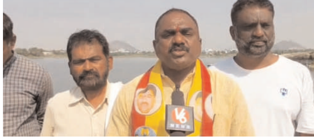
బుధవారం ఆయన విలేజులలో మాట్లాడుతూ.. గత బి ఆర్ ఎస్ ప్రభుత్వం లో ప్రవేశపెట్టిన ఉచిత చేప పిల్లల పంపిణీకి రాంరాం పలికిన కాంగ్రెస్ ప్రభుత్వం రాష్ట్ర వ్యాప్తంగా ఉన్న చేరువులన్ని గుట్టుపుడెక్కలాంటి మొక్కలతో నిండితే పూడిక తీసి పునరుద్ధరణ చేయకపోవడం దారుణమన్నారు. తెలంగాణ లో మత్స్యకారులు ఆర్థికంగా వెనుకబడి పోయారని అత్యధిక చేరువులు డ్రైనేజీ నీరు కలసి కలుషితమవుతున్నాయని గుట్టుపుడెక్క మొక్కలతో నిండిన చేరువుల్లో చేపలు ఎదగడం లేదని,