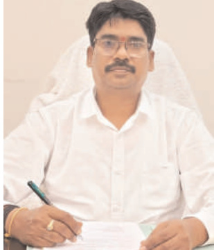
వేదిక ప్రాంగణంలో ఈ కార్యక్రమం