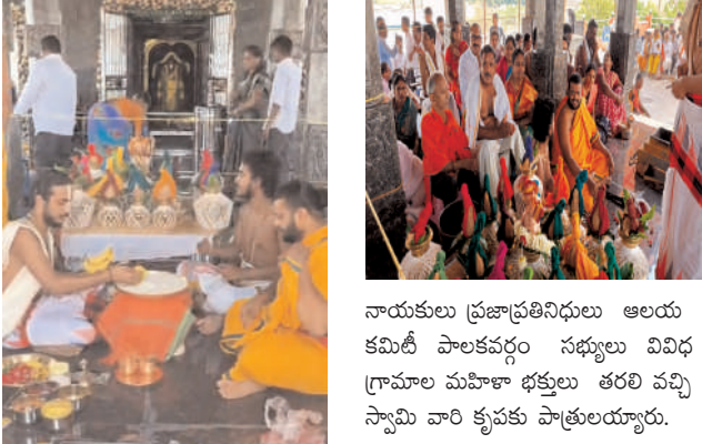
నాయకులు ప్రజాప్రతినిధులు ఆలయ కమిటీ పాలకవర్గం సభ్యులు వివిధ గ్రామాల మహిళా భక్తులు తరలి వచ్చి స్వామి వారి కృపకు పాత్రులయ్యారు.