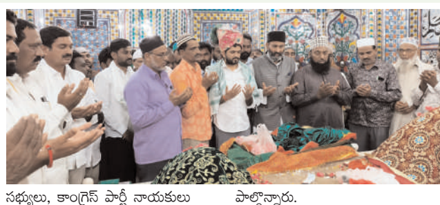
సభ్యులు, కాంగ్రెస్ పార్టీ నాయకులు పాల్గొన్నారు.