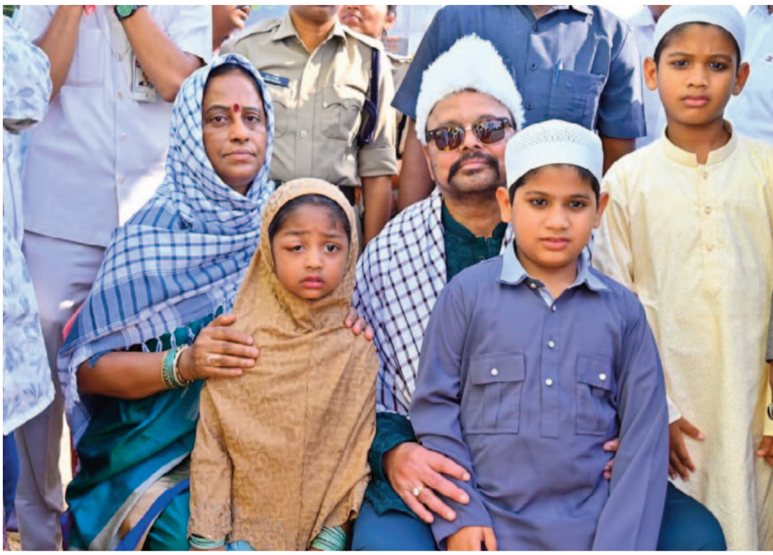
పరిష్కారానికి కృషి చేస్తామని హామీ ఇచ్చారు. సమాజంలో ప్రార్థించిన మంత్రి సురేఖ, తెలంగాణ రాష్ట్రంలో పాటు ఉన్న ముస్లిం సోదర సోదరిమణులందరికీ శాంతి, సామరస్యాల నెలకొనాలని, ప్రజలందరూ ఆయురారోగ్యాలతో సుఖసంతోషాలతో ఉండాలని అల్లాసు బక్రీడ్ పండుగ శుభాకాంక్షలు తెలిపారు.