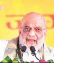
అక్రమ వలసలు, ఇతర కారణాలతో దేశంలో చోటుచేసుకుంటున్న 'అసహజ జనాభా మార్పు'పై ఉన్నత స్థాయి కమిటీని ఏర్పాటు చేసినట్లు కేంద్ర హోం మంత్రి అమిత్ షా ప్రకటించారు.