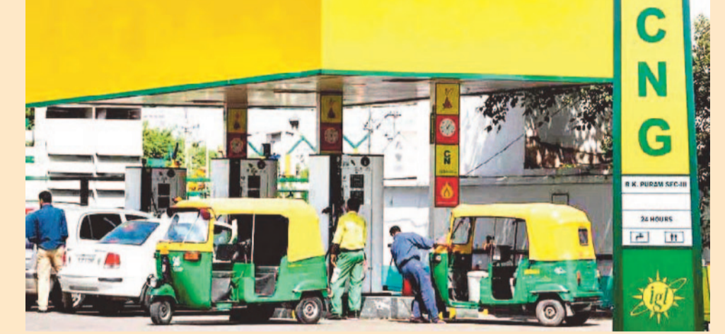
ఎన్నికల ముగిసాక వరుసగా ధరలు పెంచుకుంటూ పోతున్నది. తాజాగా మరోసారి ఇంధన ధరలను పెంచింది. సోమవారం నాడు పెట్రోల్ పై లీటర్ కు రూ. 2.61, డీజిల్ పై లీటర్ కు రూ. 2.71 చొప్పున ధరలు పెరిగాయి. తాజా పెంపుతో మే 15 నుంచి

న్యూఢిల్లీ, మే 26: కేంద్రం మళ్లీ షాకిచ్చింది. సిఎన్జి ధరలను మరోసారి పెంచింది. కిలో సీఎన్జిపై రూ.2 పెంచింది. పెరిగిన ధరలు మంగళవారం నుంచే అమలులోకి వచ్చాయి. తాజా పెంపుతో ఢిల్లీలో సీఎన్జి ధర రూ.81.09 నుంచి రూ.83.09కి చేరింది. సీఎన్జి ధరలను పెంచడం మే 15వ తేదీ నుంచి ఇది నాలుగోసారి కావడం గమనార్హం. మే 15వ తేదీ మొదట కిలోకు రూ.2 పెంచగా.. అనంతరం రెండుసార్లు ఒక్క రూపాయి చొప్పున కేంద్రం పెంచింది. తాజాగా మరో రూ.2 పెరగడంతో నాలుగోసారి సీఎన్జి ధరలు పెరిగినట్లయ్యింది. గత 11 రోజుల్లో మొత్తం రూ.7 వరకు ధరలు పెరగడంతో వాహనదారులు, ఆటో, క్యాబ్, ట్రాన్స్పోర్ట్ రంగాలపై అదనపు భారం పడనుంది. ఎన్నికల ముందు ఇంధన ధరలు పెంచబోమని వదపదే ప్రకటించిన కేంద్రం..