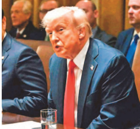
కాపాడేందుకు అవసరమైతే మరొక కఠిన నిర్ణయాలు తీసుకుంటామని కూడా చెప్పారు. కాగా, తమ వద్ద ఉన్న శుద్ధి చేసిన యురేనియంను వదులుకోవడానికి ఇరాన్ అంగీకరించినట్లు వార్తలు వస్తున్నాయి. తాము

వాషింగ్టన్, మే 26: అమెరికా-ఇరాన్ మధ్య జరుగుతున్న శాంతి చర్చల్లో అణు కార్యక్రమం కీలకం అని అమెరికా కోరుతుండగా, అందుకు ఇరాన్ పూర్తిగా అంగీకరించడం లేదు. తాజాగా ఇరాన్ అణు కార్యక్రమంపై అమెరికా అధ్యక్షుడు డొనాల్డ్ ట్రంప్ కీలక వ్యాఖ్యలు చేశారు. ఇరాన్ వద్ద ఉన్న అధికంగా శుద్ధి చేసిన యురేనియంను అమెరికాకు అప్పగించాలని, లేదంటే అంతర్జాతీయ పర్యవేక్షణలో పూర్తిగా ధ్వంసం చేయాలని ట్రంప్ స్పష్టం చేశారు. ఇరాన్ అణు కార్యక్రమం ప్రపంచ దేశాలకు ముప్పుగా మారే అవకాశముందని ట్రంప్ హెచ్చరించారు. అధిక శుద్ధి చేసిన యురేనియం ద్వారా అణ్వాయుధాల తయారీ సాధ్యమవుతుందని, అందుకే దీనిపై కఠిన చర్యలు అవసరమని పేర్కొన్నారు. అమెరికా జాతీయ భద్రతను