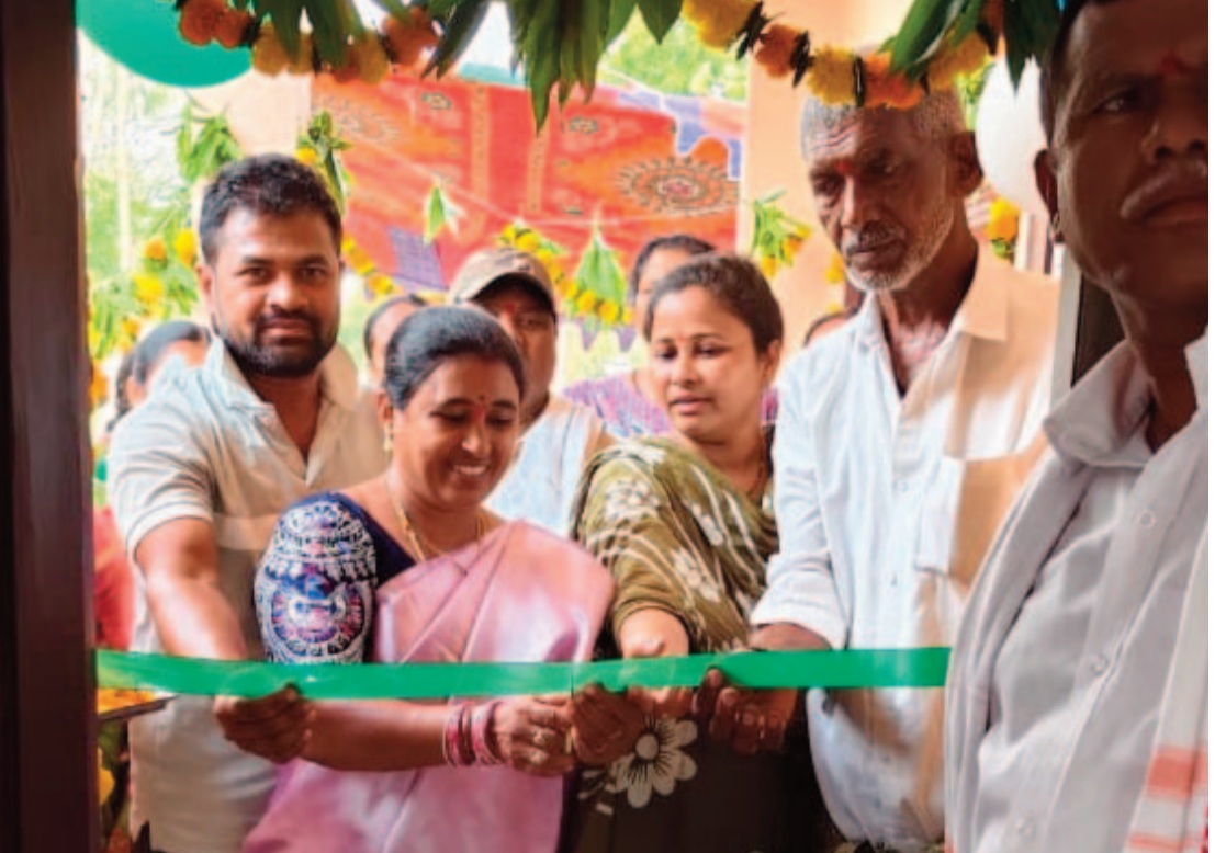
కొత్త కేంద్రం ఎంతో దోహదపడుతుందని అధికారులు ఈ సందర్భంగా పేర్కొన్నారు