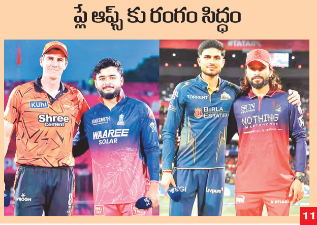
ష్టే ఆఫ్ కు రంగం సిద్ధం

Published From Jagital, Hyderabad, Adilabad, Warangal