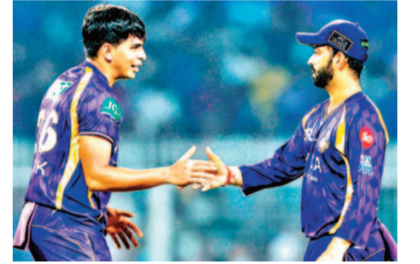
ప్లే ఆఫ్స్ ఆశలు సజీవం..