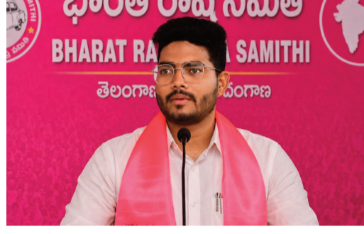
రావాలని డిమాండ్ చేశారు. కొండగల్ తరహాలో ఆదిలాబాద్ అభివృద్ధికి రూ.5వేల కోట్లు కేటాయించాలని డిమాండ్ చేశారు.

సబ్సిడీ అందడం లేదని విమర్శించారు. రైతుబంధు చెల్లింపుల్లో తీవ్ర జాప్యం జరుగుతోందని, జొన్నల కొనుగోలులో పరిమితులు విధించడం, గన్నీ సంచల కొరత కారణంగా రైతులు తీవ్ర ఇబ్బందులు ఎదుర్కొంటున్నారని ఆవేదన వ్యక్తం చేశారు. ముఖ్యమంత్రి రేవంత్ రెడ్డి దత్తత జిల్లా అయిన ఆదిలాబాద్ మూడు బడ్జెట్ సమావేశాలు ముగిసినా కనీస నిధులు కేటాయించక పోవడం జిల్లా ప్రజలను అవమానించడమేనని అన్నారు. ప్రజాపాలన పేరుతో ప్రభుత్వం వ్యతిరేక స్వరాలపై కేసులు పెట్టడం తప్పా అభివృద్ధి పనులు చేపట్టడం లేదని ఆరోపించారు. జూన్ 2న ఆదిలాబాద్ రాసున్న ముఖ్యమంత్రి ప్రత్యేక నిధులు, ఎయర్పోర్ట్, ఇంజనీరింగ్