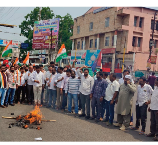
కార్యక్రమంలో గ్రంథాలయ చైర్మన్, మాజీ కార్పొరేటర్లు, సీనియర్ కాంగ్రెస్ నాయకులు, డిజిఎన్ అధ్యక్షులు, మహిళా నాయకులు, కాంగ్రెస్ కార్యకర్తలు, యూత్ కాంగ్రెస్ సభ్యులు పాల్గొన్నారు.

పెంచుతోందని తెలిపారు. ప్రజల సంక్షేమాన్ని దృష్టిలో పెట్టుకుని కేంద్ర ప్రభుత్వం వెంటనే పెట్రోల్, డీజిల్ ధరల పెంపు నిర్ణయాన్ని వెనక్కి తీసుకోవాలని డిమాండ్ చేశారు. ప్రజలపై అదనపు భారాలు మోపడం కాకుండా వారి జీవన ప్రమాణాలు మెరుగుపడేలా చర్యలు తీసుకోవాలని కోరారు. ప్రజల సమస్యలపై కాంగ్రెస్ పార్టీ ఎల్లప్పుడూ ప్రజల పక్షాన నిలబడి పోరాటం కొనసాగిస్తుందని, అవసరమైతే రాష్ట్ర వ్యాప్తంగా, దేశ వ్యాప్తంగా మరన్ని ఉద్యమాలు చేపడతామని హెచ్చరించారు. ఈ