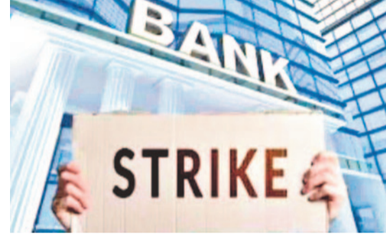
వంటి బాధ్యతల కారణంగా ఉద్యోగులపై ఒత్తిడి పెరుగుతోందని తెలిపింది. ఈ పరిస్థితుల్లో వారానికి ఐదు రోజుల పనివిధానం అమలు చేస్తే ఉద్యోగుల సామర్థ్యం మరింత మెరుగువుతుందని అభిప్రాయపడింది. అలాగే ఈ నిర్ణయం వల్ల దేశవ్యాప్తంగా లక్షలాది మంది బ్యాంకు ఉద్యోగుల ప్రయాణ భారం తగ్గుతుందని సంఘం పేర్కొంది. ఒక రోజు అదనపు సెలవు కారణంగా పెట్రోల్, డీజిల్ వినియోగం తగ్గడంతో పాటు ట్రాఫిక్ రద్దీ కూడా కొంత మేర

న్యూఢిల్లీ, మే 14: దేశవ్యాప్తంగా బ్యాంకింగ్ రంగంలో వారానికి ఐదు రోజుల పనిదినాల అమలుపై మరోసారి చర్చ ప్రారంభమైంది. బ్యాంకు ఉద్యోగ సంఘాలు చాలా కాలంగా చేస్తున్న ఈ డిమాండ్‌ను మళ్ళీ కేంద్ర ప్రభుత్వం ముందుకు తీసుకెళ్లాయి. వారానికి ఐదు రోజుల పని విధానాన్ని తక్షణమే అమలు చేయాలని కోరుతూ బ్యాంకింగ్ ఉద్యోగ సంఘాలు ప్రధాని నరేంద్ర మోదీకు లేఖ రాశాయి. దేశవ్యాప్తంగా బ్యాంకు అధికారులను ప్రాతినిధ్యం వహిస్తున్న ఆల్ ఇండియా బ్యాంక్ అఫీసర్స్ కాన్ఫెడరేషన్ ఈ మేరకు కేంద్ర ప్రభుత్వానికి వినతిపత్రం సమర్పించింది. ఐదు రోజుల పనిదినాల అమలు కేవలం ఉద్యోగుల సేవా నిబంధనలకు సంబంధించిన అంశం మాత్రమే కాదని, ఇది ఇంధన పరిరక్షణ, పర్యావరణ సంరక్షణ, శక్తి వినియోగ తగ్గింపు, కార్యనిర్వహణ సామర్థ్యం వంటి అనేక ప్రయోజనాలకు దోహదపడుతుందని సంఘం పేర్కొంది. ప్రస్తుతం బ్యాంకు ఉద్యోగులు భారీ పని ఒత్తిడిలో పనిచేస్తున్నారని సంఘం వెల్లడించింది. శాఖల నిర్వహణ, నగదు లావాదేవీలు, వినియోగదారుల సేవలు, రుణ పసూకు ప్రభుత్వ పథకాల అమలు, గ్రామీణ ఆర్థిక సేవ విస్తరణ