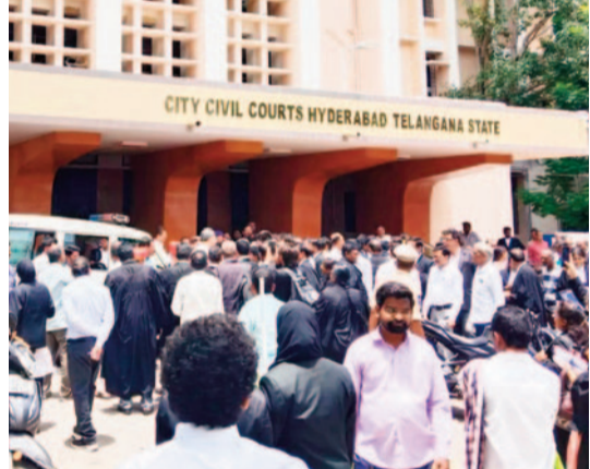
ఇప్పటివరకు సోషల్ మీడియాలో పోస్ట్ చేసిన వీడియో క్లిప్పింగులు, డిజిటల్ కంటెంట్, పత్రికా కటింగులు, వాల్ పోస్టర్లు తక్షణం తొలగించాలని స్పష్టం చేసింది. ఈ నెల