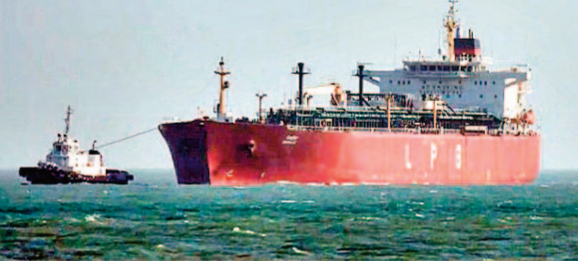
ముడివస్తులు, వంటగ్యాస్ సరఫరాలో కూడా ఈ మార్గం అత్యంత ప్రాధాన్యత కలిగి ఉంది. అందువల్ల ఈ ప్రాంతంలో ఉద్రిక్తతలు పెరిగిన ప్రతిసారి ప్రపంచ ఇంధన మార్కెట్ పై ప్రభావం పడుతుంది. ఇటీవల అమెరికా, ఇరాన్ మధ్య పరిస్థితులు మరింత ఉద్రిక్తంగా మారాయి. ఇరాన్‌తో కాల్పులు విరమణ చర్యలు క్షిప్ర పరిస్థితుల్లో ఉన్నాయని అమెరికా అధ్యక్షుడు డొనాల్డ్ ట్రంప్ వ్యాఖ్యానించారు. అమెరికా ప్రతిపాదించిన శాంతి ఒప్పందంపై ఇరాన్ స్పందన పూర్తిగా సంకీర్ణకరంగా లేదని ఆయన తన సామాజిక మాధ్యమ వేదికలో పేర్కొన్నారు. పాకిస్థాన్

న్యూఢిల్లీ, మే 14: అమెరికా-ఇరాన్ మధ్య ఉద్రిక్త పరిస్థితులు కొనసాగుతున్నప్పటికీ భారత్‌కు వంటగ్యాస్ సరఫరాలో కీలకమైన పరిణామం చోటుచేసుకుంది. పర్యాయ గల్ఫ్ ప్రాంతం నుంచి భారత్‌కు ఎల్‌పీజీ తీసుకువస్తున్న రెండు నౌకలు వ్యూహాత్మకంగా అత్యంత కీలకమైన హార్నూజ్ జలసంధిని విజయవంతంగా దాటాయి. దీంతో ప్రపంచ ఇంధన రవాణాలో కీలకమైన ఈ సముద్ర మార్గంలో సరఫరాలు మళ్ళీ క్రమంగా సాధారణ స్థితికి చేరుతున్నాయనే సంతకాలు కనిపిస్తున్నాయి. సమాచారం ప్రకారం 'సిమి' పేరుతో ప్రయాణిస్తున్న ఎల్‌పీజీ నౌక గురువారం ఒమన్ గల్ఫ్ ప్రాంతంలోకి ప్రవేశించింది. ఖతార్‌లోని రాస్ లఫాన్ పోర్టు నుంచి బయలుదేరిన ఈ నౌక గుజరాత్‌లోని కాండ్లా పోర్టుకు వస్తోంది. ప్రయాణ సమయంలో భద్రతా కారణాల దృష్ట్యా ఈ నౌక తన ట్రాన్స్‌పాసిఫిక్ సంతకాలను తాత్కాలికంగా నిలిపివేసినట్లు అంతర్జాతీయ నౌకాశ్రయ వర్గాలు తెలిపాయి. ఇక యు నైట్‌జ్ అరబ్ ఎమిరేట్స్‌లోని రువాయిస్ రిఫైనరీ నుంచి బయలుదేరిన 'ఎస్సీ సన్‌షైన్' అనే మరో వంటగ్యాస్ నౌక కూడా హార్నూజ్ జలసంధిని దాటి భారత్ జలాల్ దిగా ప్రయాణిస్తోంది. ఈ నౌక కర్ణాటకలోని మంగళూరు పోర్టుకు చేరుకోనున్నట్లు సమాచారం. ఈ నౌక కూడా జలసంధి దాటిన అనంతరం తన సిగ్నల్ వ్యవస్థను నిలిపివేసినట్లు తెలుస్తోంది. ప్రపంచ ముడివస్తులు, ప్రసిద్ధమైన సహజ వాయువు రవాణాలో హార్నూజ్ జలసంధి అత్యంత కీలక పాత్ర పోషిస్తుంది. మధ్యప్రాచ్య దేశాల నుంచి ఆసియా దేశాలకు వెళ్లే ఇంధన సరఫరాలో పెద్ద భాగం ఈ సముద్ర మార్గం ద్వారానే సాగుతుంది. భారత్‌కు అవసరమైన