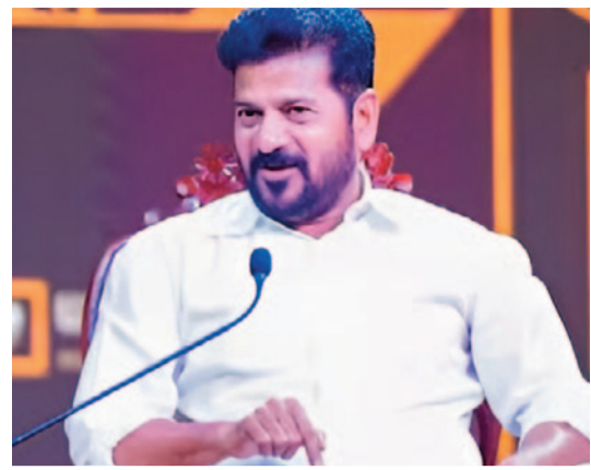
అని స్పష్టం చేశారు. కాంగ్రెస్ ముందు ప్రకటించి తర్వాత

శుక్రవారం హైదరాబాద్ వేదికగా సీఎం మోక్షదాసు. టీడీపీలో పదేళ్లు పనిచేశానని.. సీఎం చంద్రబాబు ఇప్పటికీ తనను గౌరవిస్తారని ప్రస్తావించారు. పార్టీని వదిలిపెట్టిన తర్వాత నాయకుల మధ్య మంచి సంబంధాలు ఉండటం చాలా అరుదని తెలిపారు. పార్టీని వదిలిపెట్టే సమయంలో విజయవాడకు వెళ్లి చంద్రబాబుకు చెప్పి వచ్చానని గుర్తుచేశారు. కాంగ్రెస్ను దేశంలో అధికారంలోకి తీవలని రాహుల్ గాంధీకి లక్ష్యం ఉందని...కాని ప్రధాని కావాలన్న లక్ష్యం లేదని స్పష్టం చేశారు. వికారాబాద్ లో జరిగిన కాంగ్రెస్ సమావేశంలో ప్రధాని పదవి తీసుకోవాలని తానే రాహుల్ గాంధీకి చెప్పి ఒప్పించానని ప్రస్తావించారు. ఇప్పుడు జనం స్విగ్గి పోలిటిక్స్ కోరుకుంటున్నారని అన్నారు. వచ్చే ఎన్నికల్లో ఇండియా కూటమి నుంచి ప్రధాని అభ్యర్థి రాహుల్ గాంధీనే