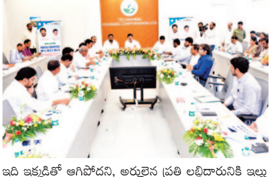
ఇది ఇక్కడితో ఆగిపోవద్ద, అర్ధవైద్య ప్రతి లబ్ధిదారునికి ఇల్లు అందే వరకు మూడో, నాలుగో విడతలుగా కొనసాగుతుందని స్పష్టం చేశారు. ఉమ్మడి రాష్ట్రంలో ఇందిరమ్మ పథకం కింద రూ.20 వేల వరకు సాయం పొందిన వారికి కూడా మళ్లీ ఇందిరమ్మ ఇండ్లు మంజూరు చేస్తామని తెలిపారు. పైల్డ్ గ్రామాల్లో 600 చదరపు అడుగులకు పైగా నిర్మించిన

గూడులేని ప్రతి అర్ధ పేద కుటుంబానికి సొంత ఇల్లు కల్పించడమే ప్రభుత్వ లక్ష్యమని పేర్కొన్నారు. దేశంలో ఏ రాష్ట్ర ప్రభుత్వం ఇప్పటి వరకు ఒక్కో ఇంటికి రూ.5 లక్షల అర్థిక సాయం అందిస్తూ తెలంగాణ ప్రభుత్వం పేదల గృహనిర్మాణంలో దేశానికి ఆదర్శంగా నిలుస్తోందన్నారు. తొలి విడతలో 3 లక్షలకు పైగా ఇండ్లను మంజూరు చేశామని, అందులో 2.90 లక్షల ఇండ్లకు గ్రౌండింగ్ పూర్తి కాగా ఇప్పటికే సుమారు 50 వేల గృహప్రవేశాలు జరిగాయని తెలిపారు. మరో రెండు లక్షలకు పైగా ఇండ్లు వివిధ దశల్లో నిర్మాణంలో ఉన్నాయని, రెండు నెలల్లో పూర్తి అవుతాయని చెప్పారు. ప్రతి నియోజకవర్గానికి 3,500 ఇండ్లు మంజూరు చేసినట్లు మంత్రి వెల్లడించారు. బి.డి.పి ప్రాంతాల నియోజకవర్గాలకు అదనపు ఇండ్లు కేటాయించినట్లు తెలిపారు. రెండో విడత ఇందిరమ్మ ఇండ్ల మంజూరు కార్యక్రమాన్ని జూన్ 2వ తేదీన అధికారికంగా ప్రారంభిస్తామని పేర్కొన్నారు.