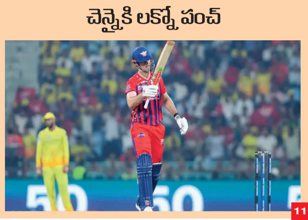
చెన్నైకి లక్ష్మీ పంచ్

Published From Jagital, Hyderabad, Adilabad, Warangal