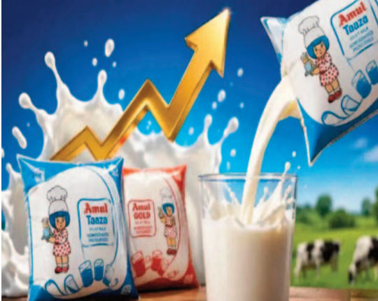
రూపాయలకు చేరుకుంది. పాల ధరల పెంపుకు అనేక కారణాలు ఉన్నాయని డైరీ సంస్థలు చెబుతున్నాయి. ముఖ్యంగా పశువుల దాణా ధరలు భారీగా పెరగడం ప్రధాన కారణంగా పేర్కొంటున్నాయి. గడ్డి, తవుడు, ఇతర పశు ఆహార పదార్థాల ధరలు పెరగడంతో పాల ఉత్పత్తి వ్యయం గణనీయంగా పెరిగిందని సంస్థలు వెల్లడించాయి. అదేవిధంగా రవాణా ఖర్చులు కూడా పెరిగాయి. పెట్రోల్,

న్యూఢిల్లీ, మే 14: నిత్యావసర వస్తువుల ధరల పెరుగుదలతో ఇప్పటికే ఇబ్బందులు ఎదుర్కొంటున్న ప్రజలకు ప్రముఖ డైరీ సంస్థలు మరో షాక్ ఇచ్చాయి. దేశీయ ప్రముఖ పాల ఉత్పత్తుల సంస్థ అమూల్ పాలు ధరలను పెంచుతున్నట్లు ప్రకటించింది. అమూల్ బ్రాండ్ ఉత్పత్తులను మార్కెటింగ్ చేసే గుజరాత్ కో-ఆపరేటివ్ మిల్క్ మార్కెటింగ్ ఫెడరేషన్ అన్ని రకాల పాల ప్యాకెట్లపై లీటరుకు రెండు రూపాయల చొప్పున ధరలు పెంచింది. ఈ కొత్త ధరలు మే 14 నుంచి దేశవ్యాప్తంగా అమల్లోకి వచ్చాయి. ధరల పెంపుతో అరటిలీటర్ అమూల్ గోల్డ్, అమూల్ టాజా, అమూల్ శక్తి పాల ప్యాకెట్ల ధర ఒక్కో రూపాయి మేర పెరిగింది. లీటర్ అమూల్ గోల్డ్ పాలు ధర 68 రూపాయల నుంచి 70 రూపాయలకు చేరగా, అమూల్ టాజా ధర 55 రూపాయల నుంచి 57 రూపాయలకు పెరిగింది. అమూల్ బాటలోనే మరో ప్రముఖ డైరీ సంస్థ మదర్ డెయిరీ కూడా పాల ధరలను పెంచుతున్నట్లు ప్రకటించింది. ముఖ్యంగా ఢిల్లీ పరిసర ప్రాంతాలు, ఇతర నగరాల్లో లీటర్ పాలపై రెండు రూపాయల వరకు పెంపు అమలు చేస్తున్నట్లు వెల్లడించింది. గేడ్ పాలు ధర లీటరుకు 75 రూపాయల నుంచి 80 రూపాయలకు పెరగగా, ఫుల్ క్రీమ్ పాలు ధర 69 రూపాయల నుంచి 72