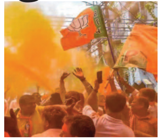
చెబుతుంది. మరోవైపు ఈ ప్రమాణ స్వీకార కార్యక్రమం ఏర్పాట్లపై ప్రభుత్వ ఉన్నతాధికారులు ఇప్పటికే దృష్టి కేంద్రీకరించారు.

సమీక్ భట్టాచార్య బుధవారం కోల్కతాలో ప్రకటించారు. ఉదయం 10 గంటలకు మహానగరంలోని ప్రతిష్టాత్మక ట్రిగేడ్ పరేడ్ గ్రౌండ్ లో ఈ కార్యక్రమం జరుగుతుందని వివరించారు. గురువారం సాయంత్రం కోల్కతాలో శాసనసభా పక్ష సమావేశం జరుగుతుందని సమీక్ భట్టాచార్య తెలిపారు. ఈ సమావేశంలో శాసనసభా పక్ష నేతను పార్టీ ఎమ్మెల్యేలు అంతా కలిసి ఎన్నుకుంటారని చెప్పారు. ముఖ్యమంత్రి ప్రమాణ స్వీకార కార్యక్రమానికి ప్రధాని నరేంద్ర మోదీ, పలువురు కేంద్ర మంత్రులు, బీజేపీ పాలిత రాష్ట్రాల ముఖ్యమంత్రులు, ఎన్డీయే నాయకులు హాజరవుతారని అంచనా వేస్తున్నారు. కార్యక్రమానికి పార్టీ సీనియర్ నేతలతోపాటు కార్యకర్తలు పెద్ద ఎత్తున హాజరవుతారని పార్టీ నేతలు చెబుతున్నారు. పశ్చిమ బెంగాల్ లో కొత్తగా కొలువుదీరనున్న మంత్రి వర్గంలో దాదాపు 24 మంది మంత్రులుగా ప్రమాణ స్వీకారం చేసే అవకాశాలు ఉన్నాయని రాష్ట్ర నాయకత్వం