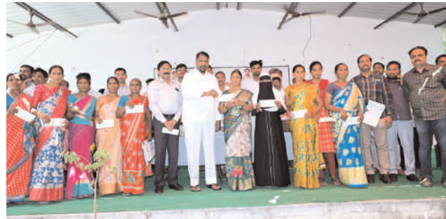
25.40 లక్షల విలువైన చెక్కులను మంత్రి అందజేశారు. అధికారులు

మొదటి పేజీ తరువాయి... ప్రభుత్వం చేపట్టిన ప్రజా పాలన ప్రగతి ప్రణాళిక కార్యక్రమంలో భాగంగా ప్రతి గ్రామానికి వచ్చి సమస్యలు గుర్తించి వాటిని పరిష్కరిస్తానని మంత్రి హామీ ఇచ్చారు. ఎండపల్లి, వెల్లటూర్ మండలాలకు చెందిన 32 మంది కల్యాణ లక్ష్మి లబ్ధిదారులకు చెక్కులను మంత్రి చేతుల మీదుగా అందజేశారు. వివిధ ప్రైవేటు ఆసుపత్రుల్లో వైద్య చికిత్సలు చేయించు కున్న 78 మంది సీఎం సహాయనిధి లబ్ధిదారులకు రూ.