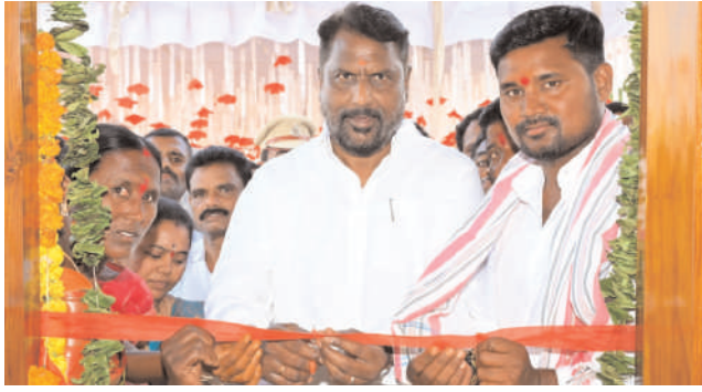
ర్బంగా మంత్రి అడ్డూరి లక్ష్మణ్ కుమార్ తెలిపారు. అర్బులైన ప్రతి కుటుంబానికి మాట్లాడుతూ ప్రభుత్వం పేదల సంక్షేమానికి కట్టుబడి ఉందని ప్రభుత్వ-పథకాలు చేరేలా చర్యలు తీసుకుంటున్నామని మంత్రి -2లో

చురకలు విలేకరి, గొల్లపల్లి, ఏప్రిల్ 6 : అర్బులైన ప్రతి ఒక్కరికి ప్రభుత్వ పథకాలను అందించడమే తమ లక్ష్యమని రాష్ట్ర సాంఘిక సంక్షేమ శాఖ మంత్రి అడ్డూరి లక్ష్మణ్ కుమార్ అన్నారు. గొల్లపల్లి మండలం చిల్డ్రన్ డూరు గ్రామపంచాయతీ కార్యాలయ ఆవరణలో సోమవారం కల్యాణ లక్ష్మి, ముఖ్య మంత్రి సహాయనిధి చెక్కుల పంపిణీ మంత్రి పంపిణీ చేశారు. ఈ సంద