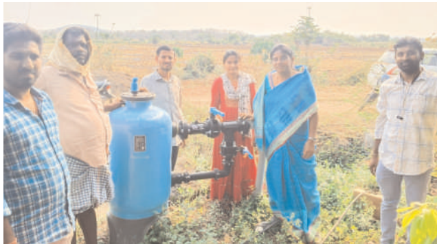
చేసిన డ్రిప్ పరికరాలను తనిఖీ చేసి డ్రిప్ వినియోగం పైన రైతులకు అవగా