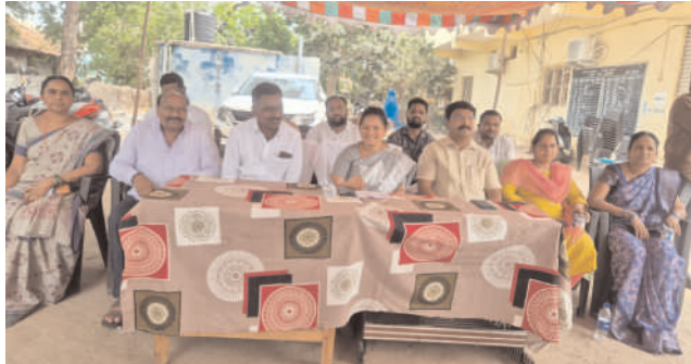
సూచనలతో మున్సిపల్ కౌన్సిల్ పక్షాన అవసరమైన చర్యలు తీసుకోవడానికి సమావేశంలో నిర్ణయించినట్లు ఆమె తెలిపారు. ముఖ్యంగా ధర్మపురి పట్టణంలో డంపింగ్ యార్డ్ ఏర్పాటుకై స్థలాభావంతో చాలా ఏళ్ళుగా ఇబ్బందులు ఎదుర్కుంటున్నామని దాని శాశ్వత పరిష్కారానికై తహశీల్దార్ తో చర్చించినట్లు తెలిపారు. అదేవిధంగా పట్టణ వార సంతలో ట్రాఫిక్