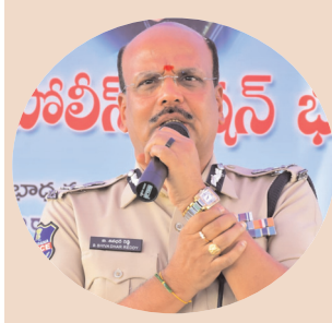
డీజీపీ శివధర్ రెడ్డి

చురకలు ప్రతినిధి సిరిసిల్ల ఏప్రిల్ 24 : రాష్ట్రంలో సిటిజన్ ఫ్రెండ్లీ పోలీసింగ్ అమలు చేస్తామని డీజీపీ బీ శివధర్ రెడ్డి తెలిపారు. రుద్రంగి మండల కేంద్రంలో రూ. 2 కోట్ల 50 లక్షలతో ఎకరం స్థలంలో ఆధునిక హంగులతో