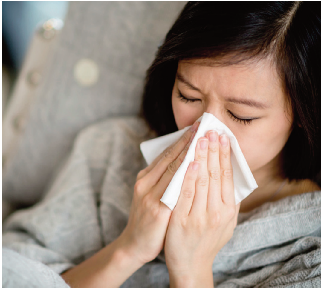
పండ్లు, కూరగాయలు, ప్రోటీన్, నీరు తాగడం చాలా బలహీనపడి ఇన్ఫెక్షన్లు వచ్చే అవకాశం ఎక్కువగా ఉంటుంది. రోజుకు కనీసం 7 గంటలు నిద్ర అవసరం.

ప్రయాణ సమయంలో ఇన్ఫెక్షన్ వచ్చే ప్రమాదం పెరుగుతుంది. శుభ్రమైన నీరు తాగండి. పచ్చి లేదా సరిగ్గా ఉడికించని మాంసం, చేపలను తినకండి. అవసరమైన టీకాలు వేయించుకోండి. సరైన ఆహారం తీసుకోకపోవడం వల్ల రోగనిరోధక శక్తి తగ్గుతుంది. అధిక చక్కెర, ఉప్పు, వేయించిన ఆహార పదార్థాలను నివారించండి. తగినంత