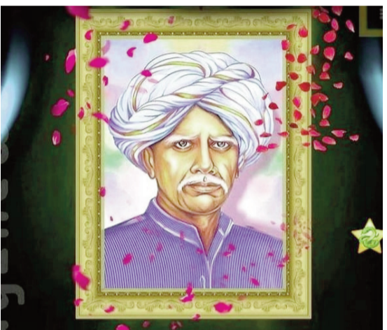
నందిన సమాజానికి బాటలు వేసిన గొప్ప సంఘసంస్కర్త, రచయిత కేండుకూరి వీరేశలింగం జయంతి: ఏప్రిల్ 16 తొలి తెలుగు నాటకకర్త వీరేశలింగం జయంతి సందర్భంగా

ఉత్తమ హాస్యనటుడు - శివమణి, 2003, ఉత్తమ హాస్యనటుడు - దూకుడు, 2001 నంది పురస్కారాలు ఆయనకు లభించాయి. అనారోగ్య కారణాలతో ఆయన చికిత్స పొందుతూ 2015, జనవరి 23 న మృతిచెందారు.