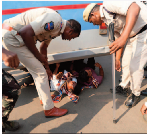
నిర్యహించారు. ఈ సందర్భంగా ట్రాఫిక్ నిలిచిపోవడంతో ప్రయాణికులు ఇబ్బందులు పడ్డారు. రాస్తారోకో నిర్యహిస్తున్న రైతులను అడ్డుకునే క్రమంలో పోలీసులు, నిరసనకారుల మధ్య తీవ్ర తోపులాట చోటుచేసుకుంది. ఉద్రిక్త పరిస్థితులు నెలకొనడంతో

వికారాబాద్, ఏప్రిల్ 15: పరిగి పారిశ్రామిక కారిడార్ కోసం చేపట్టిన భూసేకరణకు వ్యతిరేకంగా వికారాబాద్ లో నిరసన చేపట్టిన తెలంగాణ జాగృతి అధ్యక్షురాలు కవితను పోలీసులు అరెస్ట్ చేశారు. పారిశ్రామిక కారిడార్ పేరిట రైతుల భూములను బలవంతంగా సేకరించడాన్ని నిరసిస్తూ ఆమె బుధవారం ఉదయం నుంచి ఆందోళన చేపట్టారు. ఈ క్రమంలో రైతులతో కలిసి వికారాబాద్ ఆర్డీఓ కార్యాలయం ఎదుట బైరాయింపు ప్రభుత్వానికి వ్యతిరేకంగా నినాదాలు చేశారు. పారిశ్రామికీకరణ మునుగులో ప్రభుత్వం రైతుల పొట్ట కొడుతోందని కవిత ఆరోపించారు. భూసేకరణ నిలిపివేయమో కోరిక ఉన్నదాన్ని మరింత ఉద్ఘాటించే సాహసం హెచ్చరించారు. తక్షణమే భూసేకరణ నోటిఫికేషన్ వెనక్కి తీసుకోవాలని డిమాండ్ చేశారు. అంతకుముందు స్టాన్ డిస్ట్రీబ్యూషన్ చౌరస్తాలో రైతులు భారీ ఎత్తున రాస్తారోకో