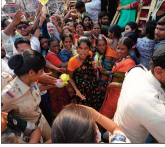
పోలీసులు కవితతో పాటు పలువురు రైతులను అదుపులోకి తీసుకున్నారు. ఈ నిరసన కార్యక్రమానికి ధర్మ సమాజ్ పార్టీ మద్దతు ప్రకటించింది. రైతుల ప్రయోజనాల కోసం పోరాటం కొనసాగిస్తామని ఆయా పార్టీల నేతలు స్పష్టం చేశారు.