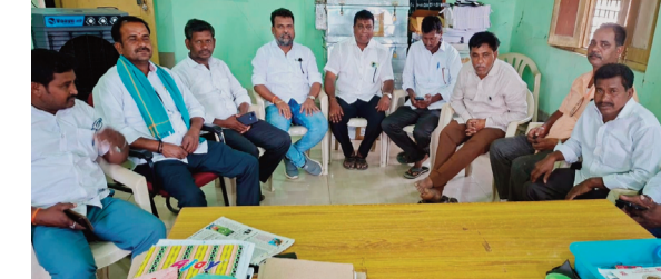
నిజామాబాద్ రూరల్ సిరికొండ, ఏప్రిల్ 10: