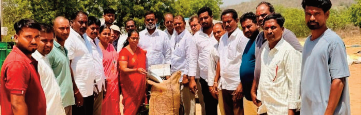
ఇందల్యాయి, ఏప్రిల్ 10: