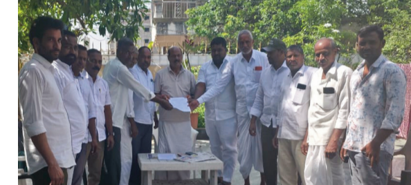
నిజామాబాద్ రూరల్ సిరికొండ, ఏప్రిల్ 10: