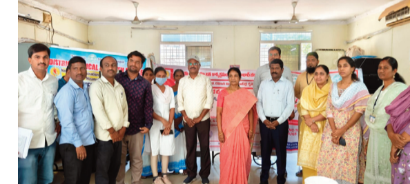
నిజామాబాద్ జిల్లా ప్రతినది, ఏప్రిల్ 10: