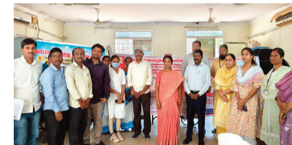
నిజామాబాద్ జిల్లా ప్రతినిధి, ఏప్రిల్ 10: