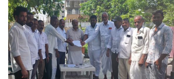
నిజామాబాద్ రూరల్ సిరికొండ, ఏప్రిల్ 10: