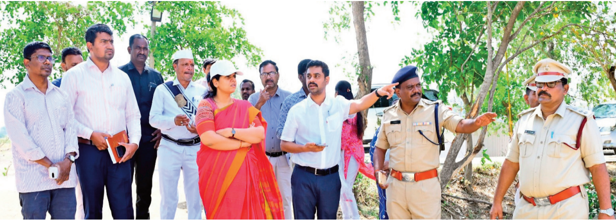
నిజామాబాద్ జిల్లా ప్రతినది, ఏప్రిల్ 10:

ఆర్ ఎస్ ఎస్ చీఫ్ మోహన్ భగవత్ ఈ నెల 11న నిజామాబాద్ జిల్లా రెంజిల్ మండలం కందుకూరి పర్వతను హాజరు కానున్న సేవల్లో కలెక్టర్ ఇలా త్రిపాఠి జిల్లా అధికారులతో కలిసి ఆయన పర్యటన ఏర్పాటును పరిశీలించారు. కందుకూరిలో కొనసాగుతున్న తుది ఏర్పాటును క్షేత్రస్థాయిలో పరిశీలించిన కలెక్టర్, అధికారులకు సూచనలు చేశారు. మోహన్ భగవత్ పర్యటనలో భద్రతా పరంగా ఎలాంటి లోటుపాట్లకు తావులేకుండా కట్టుదిట్టమైన ఏర్పాట్లు చేయాలని కలెక్టర్ ఆదేశించారు. బహిరంగ సభకు వచ్చే వారు వాహనాలను పార్కింగ్ చేసుకునేందుకు ఎంపిక చేసిన స్థలంలో ఏర్పాట్లు, సభా ప్రాంగణం, బారికేడ్లు తదితర వాటిని కలెక్టర్ పరిశీలించారు. ఆర్ ఎస్ ఎస్ చీఫ్ భద్రతకు పక్కదూరం ఇవ్వాలని ఏర్పాటు చేయాలని, ఎలాంటి అటంకాలు తలెత్తకుండా ముందస్తుగానే అన్ని జాగ్రత్తలు తీసుకోవాలని సూచించారు. ఆయా శాఖల అధికారులు సమన్వయంతో పని చేయాలని అన్నారు. సభా స్థలి వద్ద అన్ని వసతులతో కూడిన అంబులెన్స్, అగ్నిమాపక శకటం, వైద్య బృందం అందుబాటులో ఉంచాలని ఆదేశించారు. కలెక్టర్ వెంట బోధన్ సబ్ కలెక్టర్ వికాస్ మహతో, పీసీపీ శ్రీనివాస్, తహసీల్దార్ శ్రవణ్, వివిధ శాఖల అధికారులు ఉన్నారు.