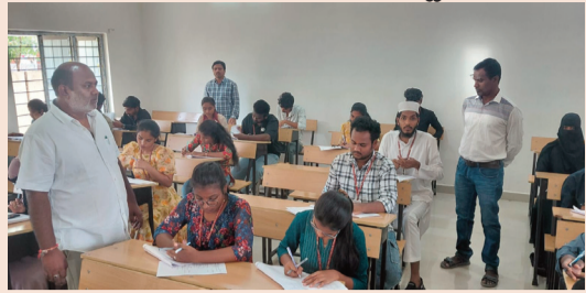
నిజామాబాద్ జిల్లా ప్రతినిధి, ఏప్రిల్ 10: