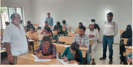
నిజామాబాద్ జిల్లా ప్రతినది, ఏప్రిల్ 10: