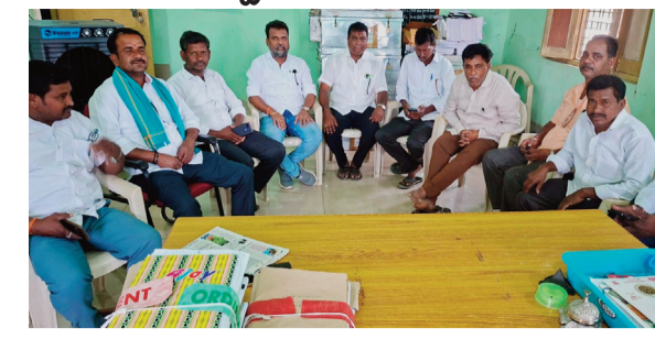
నిజామాబాద్ రూరల్ సిరికొండ, ఏప్రిల్ 10:

సిరికొండ మండల సర్పంచుల ఫోరం సమావేశం శుక్రవారం సిరికొండలో నిర్వహించారు. గ్రామాలలో ఎదురవుతున్న సమస్యలపై విస్తృతంగా చర్చించగా, ముఖ్యంగా వరి కొనుగోలు కేంద్రాల ప్రారంభం, కాకపోవడంతో రైతులు తీవ్ర ఇబ్బందులు పడుతున్నారని సర్పంచులు ఆందోళన వ్యక్తం చేశారు. వెంటనే కొనుగోలు కేంద్రాలను ప్రారంభించాలని మండల అధికారులతో ఫోన్ ద్వారా మాట్లాడినట్లు తెలిపారు. దీనికి అధికారులు సానుకూలంగా స్పందించి త్వరలోనే కేంద్రాలను ప్రారంభిస్తామని హామీ ఇచ్చినట్లు వెల్లడించారు. అదేవిధంగా రూరల్ ఎమ్మెల్యే ఆర్. భూపతి రెడ్డిపై బీజేపీ జిల్లా అధ్యక్షుడు దినేష్ కులచారి చేసిన నిరాధార ఆరోపణలను సిరికొండ సర్పంచుల ఫోరం తీవ్రంగా ఖండించింది. భవిష్యత్తులో ఇలాంటి ఆరోపణలు చేయకూడదని పత్రికా ముఖంగా హెచ్చరించారు.