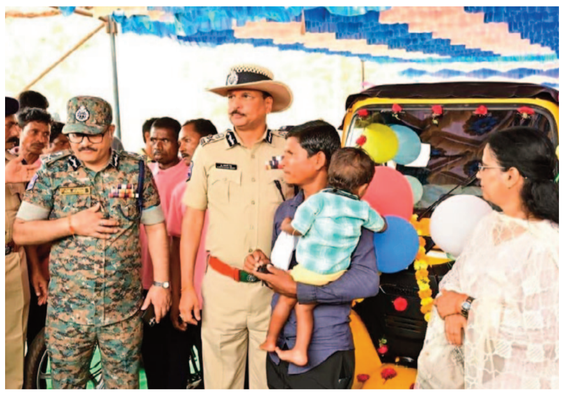
సౌకర్యం మెరుగుపడింది. అత్యవసర సమయాల్లో ఆసుపత్రికి వెళ్లడానికి గ్రామస్థుల కోసం ప్రభుత్వం ఒక ఆటో, టూ వీలర్ ను కమ్యూనిటీ వాహనాలుగా అందజేసింది. గతంలో 12-13 కిలోమీటర్లు కాలినడకన వెళ్లాలి దుస్థితి ఇప్పుడు తొలగిపోయింది. ఇప్పటికీ విద్యుత్ సౌకర్యం లేని మారుమూల ఇళ్లకు సోలార్ కండ్లక్షను పంపిణీ చేయడం ద్వారా ప్రభుత్వం చీకట్లను తొలగిస్తోంది. కనీసం ఆధార కార్డులు, ఓట హక్కు వంటి కనీస గుర్తింపు కూడా లేని ఆదివాసీలకు ఇప్పుడు అన్ని ప్రభుత్వ ఫలాలను అందించడమే లక్ష్యంగా

ములుగు, ఏప్రిల్ 7: తెలంగాణలో మావోయిస్టుల శకం ముగిసిందని డీజీపీ శివధర్ రెడ్డి అన్నారు. ఒకప్పుడు తుపాకుల మోతతో, అశాంతితో నిండిన తెలంగాణ అటవీ ప్రాంతాల్లో ఇప్పుడు శాంతి గీతం వినిపిస్తోంది. దశాబ్దాల కాలంగా మావోయిస్టులకు అడ్డాగా ఉన్న ప్రాంతాల్లో ఇప్పుడు అభివృద్ధి పరుగులు తీస్తోంది. తెలంగాణలో మావోయిజం పూర్తిగా అంతరించిందని రాష్ట్ర డీజీపీ శివధర్ రెడ్డి అధికారికంగా ప్రకటించారు. 'ఫెస్ టు ఫెస్' కార్యక్రమంలో పాల్గొన్న ఆయన, కర్రెగట్టు వంటి మారుమూల ప్రాంతాల్లో మారుతున్న పరిస్థితులను వివరించారు. ఒకప్పుడు దట్టమైన అడవుల్లో సమాంతర ప్రభుత్వాన్ని నడిపిన మావోయిస్టుల ఉనికి ఇప్పుడు తెలంగాణలో లేదని డీజీపీ స్పష్టం చేశారు. అవరోషన్ కార్గర్ విజయవంతం కావడంతో పాటు, కీలక నాయకత్వం, సైన్యవృద్ధులు సైతం బయటకు రావడంతో ఆ వ్యవస్థ పూర్తిగా కొలాప్స్ అయిందని ఆయన పేర్కొన్నారు. ఇప్పుడు ఈ ప్రాంతాలను నక్సలైట్ రహిత జోన్లుగా మారాయని, ప్రజలు స్వేచ్ఛగా తిరుగుతున్నారని తెలిపారు. గతంలో కనీసం సౌకర్యాలు లేకపోవడమే నక్సలైజం పెరగడానికి ప్రధాన కారణమని గుర్తించిన ప్రభుత్వం, ఇప్పుడు ఆ లోటును భర్తీ చేస్తోంది. జాబ్స్ ప్రపంచంతో సంబంధం లేని కర్రెగట్టు వంటి ప్రాంతాలకు ఇప్పుడు బిటి రోడ్ల నిర్మాణం జరుగుతోంది. దీనివల్ల ఆదివాసీలకు రవాణా