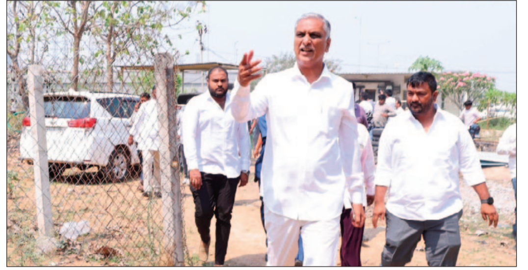
అరెస్ట్ చేశారు. రేవంత్ సర్కార్ తీరుపై ఆయన తీవ్ర ఆగ్రహం వ్యక్తం చేశారు.

పేద రైతుల భూములపై కన్ను పరిగిలో ఎస్సీ, ఎస్టీ రైతులు సాగు చేసుకుంటున్న భూములను లాక్కుని సీఎం తన సోదరుడికి కట్టబెట్టే ప్రయత్నం చేస్తున్నారని హాల్స్ రావు ఆరోపించారు. రేవంత్ పాలనను రాక్షస పాలన, గడ్డిల పాలనగా అభివర్ణించారు. సాగుకు పనికిరాని భూముల్లో పరిశ్రమలు పెట్టాలి కానీ రైతుల పొట్ట కొట్టడం ఏంటని నిలదీశారు. ప్రభుత్వం చేసినది అంతా బోగస్ పాలన అని ఎద్దేవా చేశారు.