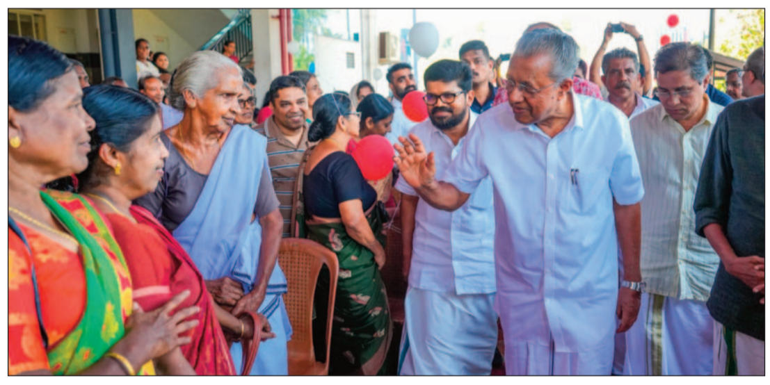
మీరు నా రాష్ట్రానికి వచ్చినప్పుడు, ఒక అతిథికి చేయాల్సిన అన్ని మర్యాదలు చేస్తానని మాట ఇస్తున్నా. ప్రస్తుత తెలంగాణ పరిస్థితికి మీరు సీఐ ఆయోగ్ ఎన్టీజీ ఇండెక్స్ 2023-24ని ప్రామాణికంగా చూపిస్తున్నారు. ఆ సూచి డిసెంబర్ 2023లో ముగిసిన బీఆర్ఎస్ వదేళ్ల దుమ్మరిపాలనను ప్రతిబింబిస్తుంది. మా ప్రభుత్వం 28 నెలలు చూపారా ఏం జరిగిందో చూపించండి' అని ఎన్టీజీ పూర్తి చేసుకుంది. 2024-25లో తెలంగాణ జీఎన్టీపీ రూ. 16.12 లక్షల కోట్లుగా ఉండి.. 10.7 శాతం వృద్ధిని సమారు చేసింది. ఇది జాతీయ సగటు 9.9 శాతం కంటే ఎక్కువ. కర్ణాటక, తమిళనాడు, మహారాష్ట్ర, కేరళలతో పోలిస్తే తెలంగాణలోనే అత్యధిక తలసరి ఆదాయం ఉన్న రాష్ట్రంగా తెలంగాణ నిలిచింది. కేరళ ప్రజలకు మీ హయాంలో ఏం జరిగిందో చూపించండి' అని ఎన్టీజీ పేర్కొన్నారు.

తిరువనంతపురం, ఏప్రిల్ 7: తనతో చర్చకు రావాలన్న సీఎం రేవంత్ రెడ్డి సవాల్ పై కేరళం ముఖ్యమంత్రి పినరయి విజయన్ తిమ్మిక్కొట్టారు. ఆయనతో చర్చకు దిగే ఉద్దేశం తనకు లేదన్నారు. రేవంత్ తో చర్చకు దిగిందనుకు తెలంగాణలో పార్టీలు ఉన్నాయని, ఆయన ప్రభుత్వ పనితీరుపై అక్కడి ప్రజలే తీర్పునిచ్చాలని వ్యాఖ్యానించారు. తమ పార్టీ నేతలు అక్కడ రేవంత్ వ్యవహారంపై మూట్టాడుతారని అన్నారు. సీఐ ఆయోగ్ 2023-24 సుస్థిరాభివృద్ధి లక్ష్యాల సూచీలో కేరళ తొలి స్థానంలో ఉందని పినరయి విజయన్ అంటున్నారని, ఇది కేరళలో ఏడు దశాబ్దాల ప్రభుత్వాన్నింటి కృషి అని సోమవారం సీఎం రేవంత్ పేర్కొన్న సంగతి తెలిసింది. అందులో కాంగ్రెస్ నేతృత్వంలోని యూడిఎఫ్ కూడా ఉందని గుర్తించాలన్నారు. అందరి కష్టాన్నీ సొంత ఖాతాలో వేసుకోవడం సరికాదని హితవు పలికారు. ఈ అంశంపై చర్చించేందుకు సిద్ధంగా ఉన్నానని, చర్చకు రాలని పినరయి విజయన్ కు సవాల్ విసిరారు. తెలంగాణ ప్రభుత్వ పనితీరును విమర్శిస్తూ కేరళ సీఎం పినరయి విజయన్ రాసిన లేఖపై సీఎం రేవంత్ రెడ్డి మరోసారి స్పందించారు. కేరళ ప్రభుత్వ పనితీరుపై తన విమర్శలను ఎంతో గౌరవప్రదంగా, హృదయాన్ని వ్యక్తం చేశానని అన్నారు. విజయన్ మాత్రం తప్పుపై స్థాయి భాషను ఉపయోగించాలని నిర్ణయించుకున్నట్లు చెప్పారు. 'మీ అనవసరపూరిత వ్యాఖ్యలకు నేను అదే రిటోల్ స్పందించను.'