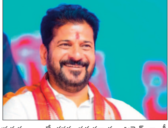
ప్రభుత్వం అంటే తనకు నచ్చదన్నారు. ఊమెన్ చాండీ కరుణాకరన్ అధ్యక్షులతో కేరళ అభివృద్ధి చెందిందన్నారు.

మొదటి పేజీ తరువాయి మధ్య ఒప్పందం ఉంది. కేసుల నుంచి మోడీ ఆయనను రక్షిస్తున్నారు. రాష్ట్రంలో యువతను విజయన్ మోసం చేస్తున్నారు. కేరళ ప్రజల నుంచి నాకు ఫీడ్ బ్యాక్ వచ్చింది. విజయన్ కు కేసీఆర్ మంచి మిత్రుడు. కేసీఆర్ పాలన గురించి విజయన్ ప్రస్తావించారని రేవంత్ అన్నారు. కేరళం యువత హార్ట్ వర్కింగ్ పీపుల్ అని సీఎం రేవంత్ రెడ్డి కొనియాడారు. తాజాగా కేరళం ఎన్నికల ప్రచారంలో పాల్గొన్న సీఎం రేవంత్ అక్కడి ప్రభుత్వంపై విమర్శలు గుప్పించారు. గల్ఫ్ దేశాల అభివృద్ధిలో కేరళం యువత పాత్ర కీలకమన్నారు. కేరళంలోనే విషాద స్థలాలకు యువనైట్ డెమోక్రటిక్ ఫ్రంట్ ప్రభుత్వం చరమాంకం పలుకుతున్నారని. యూడిఎఫ్ గవర్నమెంట్ వస్తుందిని ధీమా వ్యక్తం చేశారు. పినరయి విజయన్ అంటే తనకు గౌరవమని.. కానీ ఆయన