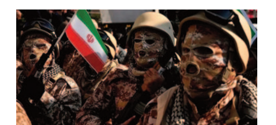
ప్రశ్నేలేదని, ప్రతికారం తీర్చుకుంటామని పునరుద్ఘాటించింది.

సంప్రదింపులు, చర్యల మార్గాల నుంచి ఇరాన్ వైదొలగింది. ఇరు దేశాల మధ్య సందేశాల మార్పిడిని కూడా ముగించింది" ఎక్స్ (ట్విట్టర్) వేదికగా వెల్లడించింది. ఇరాన్ నాగరికత మొత్తం నేటి రాత్రితో అంతమైపోతుందన్న ట్రంప్ బెదిరింపులకు ఇరాన్ దీటుగానే కొంటర్ ఇచ్చింది. అమెరికా, దాని మిత్రులు కూడా తమ దెబ్బలెలా ఉంటుందో రుచి చూస్తాయని హెచ్చరించింది. ఈ క్రమంలోనే పాకిస్తాన్, టర్కీ ఈజిప్టు మధ్యపరిష్కారంతో అమెరికాతో జరుగుతున్న చర్యలకు ఇరాన్ ముగింపు పలికింది. తమ రెడ్ లైన్స్ (హద్దులు) దాటితే పరిణామాలు తీవ్రంగా ఉంటాయని, తమ స్వందన పశ్చిమాసియా దాటి విస్తరిస్తుందని ఇరాన్ రెవల్యూషనరీ గార్డ్ కార్ప్స్ వార్నింగ్ ఇచ్చింది. ఇప్పటికే గల్ఫ్లోని అమెరికా సైనిక స్థావరాలు, ఇజ్రాయెల్పై బాలిస్టిక్, క్రూయింగ్ క్షిపణులు, డ్రోన్లతో దాడులు చేసినట్లు రివల్యూషనరీ గార్డ్ కార్ప్స్ ప్రకటించింది. సౌదీ అరేబియాలో అమెరికాకు చెందిన రెండు పెట్రోకెమికల్ కాంప్లెక్సులు, ఇజ్రాయెల్ సైనిక సామాగ్రి తరలింపే నౌకపై కూడా కచ్చితమైన దాడులు చేశామని పేర్కొంది. పౌర లక్ష్యాలను తాము టార్గెట్ చేసుకోమని, కానీ తమ పౌర మౌలిక సదుపాయాలపై దాడులు చేస్తే మాత్రం వెనకడుగు వేసే