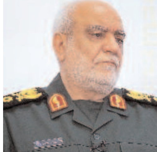
ఒక ప్రకటన విడుదల చేసింది. ఇది నేరపూరిత ఉగ్రవాద దాడి అని, ఈ దాడిలో ఖదేమీ 'షహీద్' (అమరుడు) అయ్యారని పేర్కొంది. అయితే, దాడి ఎక్కడ జరిగిందనే ప్రదేశాన్ని మాత్రం ఐఆర్ జీసీ వెల్లడించలేదు.

ఇరాన్ భద్రతా వ్యవస్థలో అత్యంత శక్తివంతమైన నిఘా విభాగానికి ఖదేమీ నాయకత్వం వహిస్తున్నారు. ఫిబ్రవరి 28 నుంచి ఇరాన్ పై అమెరికా, ఇజ్రాయెల్ దాడులు కొనసాగుతున్న విషయం తెలిసింది. అప్పటి నుంచి జరుగుతున్న దాడుల్లో ఇరాన్ అనేక మంది ఉన్నతాధికారులను కోల్పోయింది. గత నెలలోనే ఇరాన్ సెక్యూరిటీ చీఫ్ అలీ లాజానీ, ఇంటిలిజెన్స్ మంత్రి ఇస్మాయిల్ ఖతీబ్ లను ఇజ్రాయెల్ దళాలు హతమార్చాయి. అంతకుముందు ఐఆర్ జీసీ చీఫ్ మహమ్మద్ పక్ హూర్, బిజ్ జో షోర్స్ చీఫ్ ఘోలామెర్జా సలామానీ వంటి కీలక నేతలు కూడా ఈ దాడుల్లో మరణించారు. ఫిబ్రవరి 28న జరిగిన తొలి దాడిలోనే ఇరాన్ మాజీ సుప్రీం లీడర్ అయితోల్లా అలీ ఖమేనీ మరణించడం తెలిసింది. ప్రస్తుతం ఆయన కుమారుడు మొజ్జబా ఖమేనీ కొత్త సుప్రీం లీడర్ గా బాధ్యతలు నిర్వహిస్తున్నారు. ఆయన్ను కూడా లక్ష్యంగా చేసుకుంటామని అమెరికా, ఇజ్రాయెల్ హెచ్చరించింది.