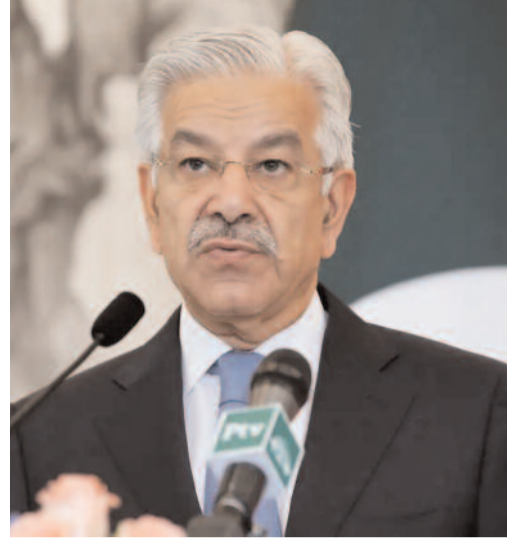
దాడులకు పాల్పడే అవకాశం ఉందని ఇంటిలిజెన్స్ సమాచారం అందింది. ఎన్నికల వాతావరణాన్ని చెడగొట్టే పాక్ ప్రధాన ఉద్దేశమని అధికారులు అనుమానిస్తున్నారు.

భారత్, బంగ్లాదేశ్ మధ్య రోజురోజుకూ బలపడుతున్న ఆర్థిక, భద్రతా సంబంధాలు పాకిస్తాన్ కంటికి పుగి మారాయి. ఈ రెండు దేశాల మధ్య చిచ్చు పెట్టేందుకు పశ్చిమ బెంగాల్ లేదా ఈశాన్య రాష్ట్రాల్లో ఉగ్ర దాడులు చేయించి, ఆ ప్రాంతాల్లో అస్థిరత సృష్టించాలని పాక్ ఐఎస్ఐ పుణ్యశాల పన్నుతోంది. విశ్లేషకులు పేర్కొంటున్నారు. పాకిస్తాన్ ఎలాంటి దుస్సాహసానికి పాల్పడినా గతంలో చేపట్టిన 'అపరేషన్ సిందూర్' తరహాలోనే అత్యంత కఠినంగా బదులిస్తామని భారత ఉన్నతాధికారి ఒకరు స్పష్టం చేశారు. "సరిహద్దుల్లో ఉగ్రవాదాన్ని ప్రేరేపిస్తే, దానిని యుద్ధ చర్యగానే పరిగణిస్తాం. ఉగ్ర స్థాపరాలను పూర్తిగా మూసివేస్తే తప్ప చర్చల ప్రసక్తి లేదు" అని భారత్ తేల్చిచెప్పింది. భారత సైన్యం దాడులతో విద్యుత్తును ఉగ్రవాద సంస్థల్లో నైతిక సైన్యం నింపేందుకు, కొత్త ఉగ్రవాదులను రిక్రూట్ చేసుకునేందుకు పాక్ మంత్రులు ఇలాంటి రెచ్చగొట్టే వ్యాఖ్యలు చేస్తున్నారని రక్షణ నిపుణులు అభిప్రాయపడుతున్నారు. ప్రస్తుతానికి కోల్ కతా సహా సరిహద్దు ప్రాంతాల్లో భద్రతను కట్టడింట్లం చేసినట్లు అధికారులు వెల్లడించారు.