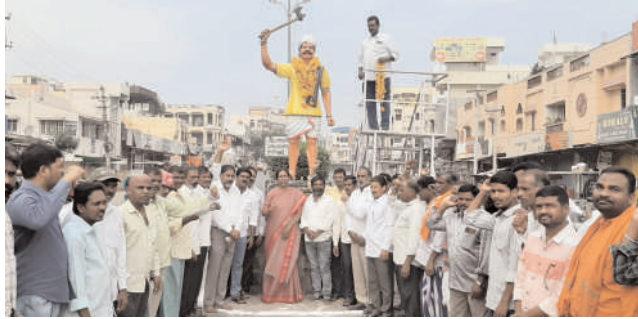
కొమురయ్య తెలంగాణ పోరాట వీరుడని తెలంగాణ పోరాట ఆయన జీవిత ఆయన జీవిత చరిత్ర పాఠ్య పుస్తకంలో చరిత్ర తెలుస్తుందని, ట్యాంక్ బండ్ చేర్చించాలని, పిల్లలకు ఆయన ఆయన విగ్రహాన్ని ఏర్పాటు