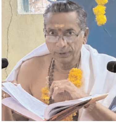
రామ నవరాత్రి ఉత్సవాల సందర్భంగా క్షేత్రంలో గోదావరి తీరాన వెలసిన రామాల యంలో, దేవాలయ వంశ పారంపర్య నిర్వాహకులు అర్చకులు