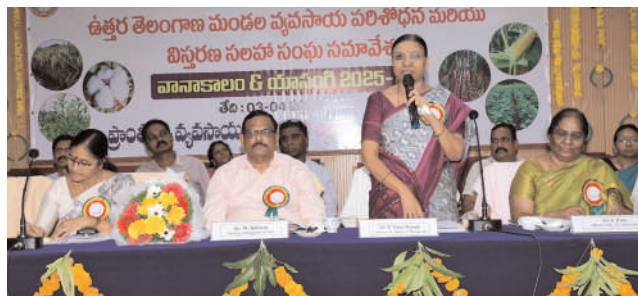
ఏప్రిల్ మొదటి వారంలో కోత కోసుకునే విధంగా రైతులు ప్రణాళికలు రూపొందించుకుంటే మాకాశాతం తగ్గించుకునే అవకాశం ఉందన్నారు. రైతులు సాంకేతిక పరిజ్ఞానాన్ని సద్వినియోగం చేసుకుంటూ, తమ