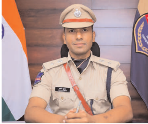
పోలీసులకు అన్ని వర్గాల ప్రజలు సహకారం అందించాలని సూచించారు.

చురకలు ప్రతినిధి, జగిత్యాల, ఏప్రిల్ 2 : జగిత్యాల జిల్లాలో శాంతి భద్రతలను దృష్టిలో ఉంచుకొని నెల ఏప్రిల్ 1వ తేదీ నుండి 30 వరకు జిల్లా వ్యాప్తంగా పోలీసు యాక్ట్ అమలులో ఉంటుందని జిల్లా ఎస్పీ అశోక్ కుమార్ తెలిపారు. బుధవారం ఆయన మాట్లాడుతూ సిటీ పోలీస్ యాక్ట్ ప్రకారం పోలీసు అధికారుల అనుమతి లేకుండా ఎలాంటి ధర్మాలు, రాస్తా రోకోలు, నిరసనలు, ర్యాలీలు, పబ్లిక్ మీటింగ్ లు, సభలు, సమావేశాలు నిర్వహించరాదన్నారు. శాంతిభద్రతలకు భంగం కలిగించే విధంగా, ప్రభుత్వ ఆస్తులకు నష్టం కల్పించే చట్ట వ్యతిరేక కార్యక్రమాలు చేపట్టరాదని ఎస్పీ సూచించారు. జిల్లా ప్రజలు పోలీసు వారికి ఈ విషయంలో సహకరించాలని శాంతిభద్రతల పరిరక్షణ కు నిరంతరం శ్రమిస్తున్న