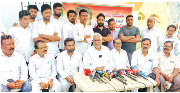
చురకలు ప్రతినిధి, జగిత్యాల, ఏప్రిల్ 1 : ప్రజా సంక్షేమమే కాంగ్రెస్ ప్రభుత్వ లక్ష్యమని, నిరుపేదలకు పట్టెడన్నం అందించడానికే తెలంగాణ ప్రభుత్వం శ్రీకారం చుట్టడం శుభపరిణామమని, దేశంలో సన్నబియ్యం పంపిణీ చేస్తున్న ఏకైక రాష్ట్రం తెలంగాణ అని మాజీ