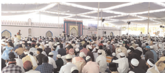
వివరించారు. ఖురాన్ లో చెప్పిన విషయాలను తూతా తప్పకుండా ప్రతి

చురకలు విలేఖరి, హుజూరాబాద్, మార్చి 31 : పట్టణంతోపాటు మండలంలోని పలు గ్రామాలలో పవిత్ర రంజాన్ పర్వదిన వేడుకలను సోమవారం ముస్లింలు భక్తిశ్రద్ధలతో జరుపుకున్నారు. ఈ సందర్భంగా పట్టణంలోని ఈద్గా మైదానంలో ముస్లింలందరూ ప్రత్యేక ప్రార్థనలు నిర్వహించారు. ముస్లిం మత గురువులు రంజాన్ పండుగ సందర్భంగా పండుగ ప్రాముఖ్యతను, విశిష్టతను