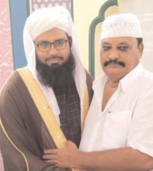
మాట్లాడుతూ నగర పంచాయతీ ఆధ్వర్యంలో ఎలాంటి ఇబ్బందులు కలగకుండా షామియాన, సౌండ్ సిస్టం, వాటర్ ట్యాంక్ ఏర్పాటు చేసినందుకు నగర పంచాయతీ