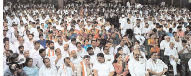
కుల గణన సర్వేపై ప్రతిపక్షాలు అనవసరంగా రాద్ధాంతం చేస్తున్నాయని, కులగణనతో తమ ఉనికి కోల్పోతామని బీ ఆర్ ఎస్, బిజెపి నేతలు ప్రజలను పక్కదారి పట్టిస్తున్నాయని మండిపడ్డారు. గ్రామాల్లో రెండు పార్టీలను ప్రజలు నమ్మే స్థితిలో లేరని పేదల సంక్షేమానికి కాంగ్రెస్ ప్రభుత్వం నిరంతరం కృషి చేస్తున్నదని పేర్కొన్నారు. త్వరలో జరగనున్న ఎమ్మెల్సీ ఎన్నికల్లో కాంగ్రెస్