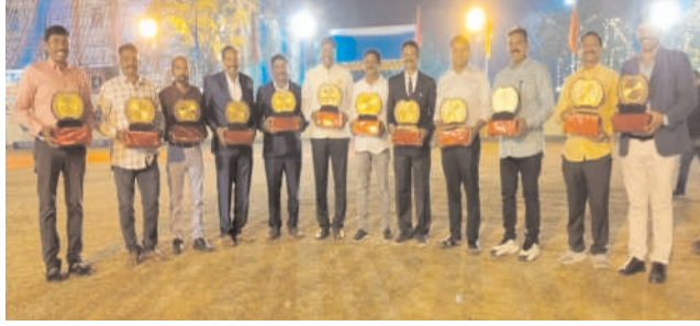
25 సంవత్సరాలు పూర్తి చేసుకున్న యాక్టివ్ రెస్ట్రూ ట్రెండ్ పర్సన్ ను ఘనంగా సన్మానించి బహుమతిని అందజేశారు. డైరెక్టర్ జనరల్ ఆఫ్