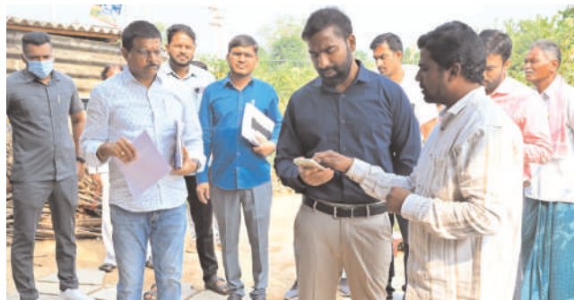
చేస్తున్న ఇంటింటి సర్వేను తనిఖీ చేశారు. యాప్ ద్వారా సర్వే చేపట్టాలని సూచించారు. ఇందిరమ్మ పథకం కింద పూర్తిస్థాయి అర్హత గల నిరుపేద